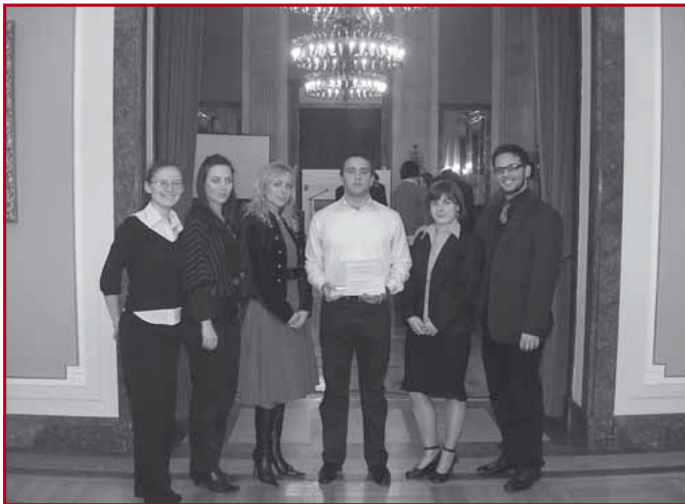
Наши студенти на пријему у Скупштини града Београда