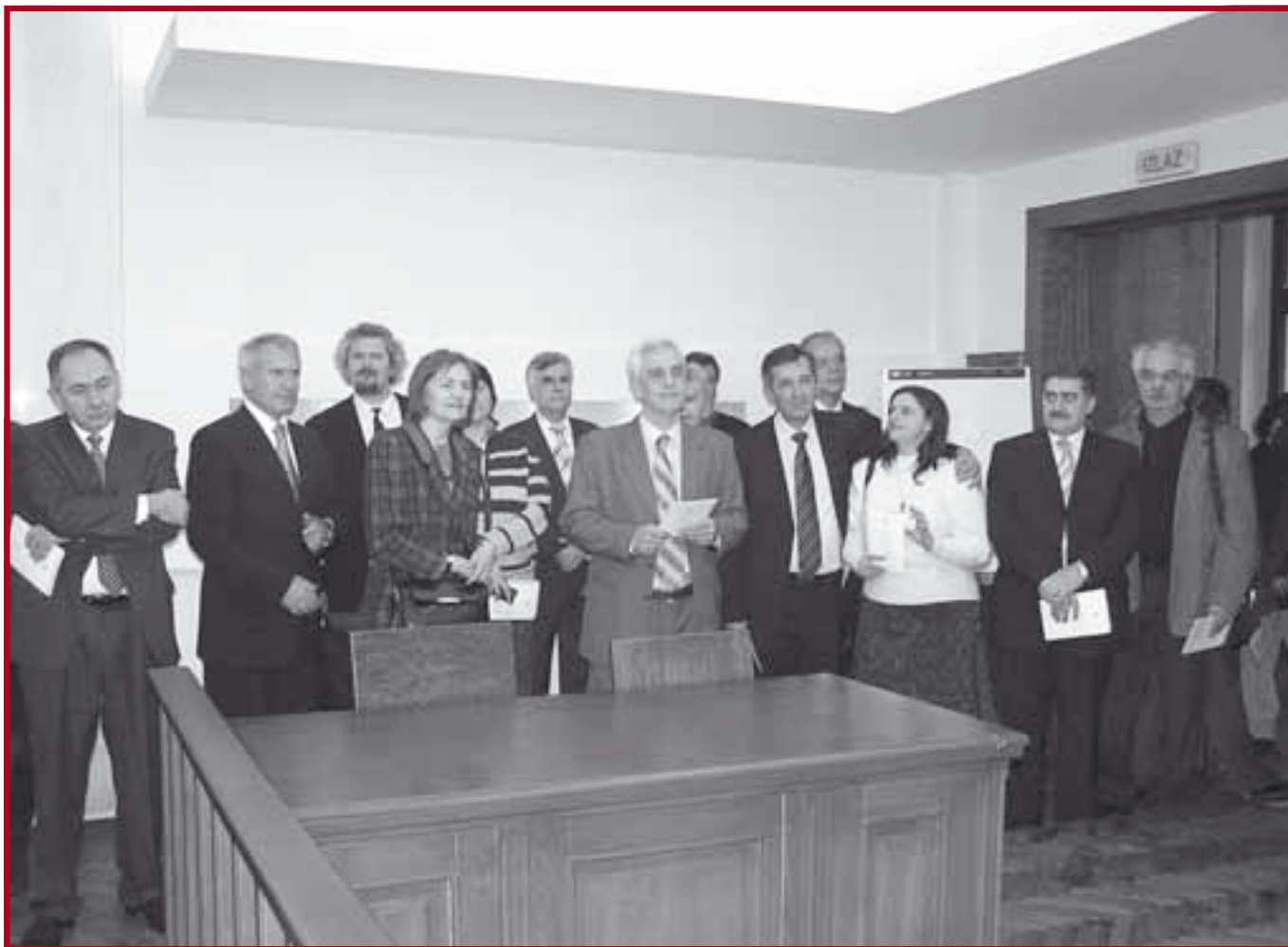
Ректор и декани Београдског универзитета у посети Правном факултету у Београду

Припремну наставу за полагање стручног испита за лиценцирање стечајних управника Правни факултет организовао је трећи пут у сарадњи с Агенцијом за стечајне управнике, у периоду од 7. фебруара до 17. марта 2007. године са фондом од 80 часова. Часови су се одржавали четвртком, петком и суботом и на њима су предавали, поред наших наставника и сарадника, истакнути стручњаци из ове области. Курс је похађало 29 полазника.