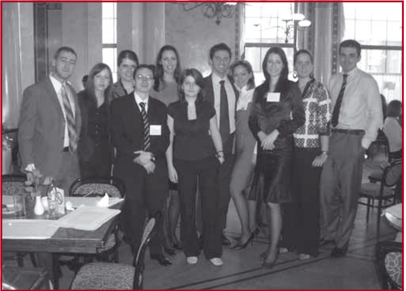
Тим Правног факултета који је на међународном такмичењу у Бечу освојио III место

Издавач Правни факултет Универзитета у Београду