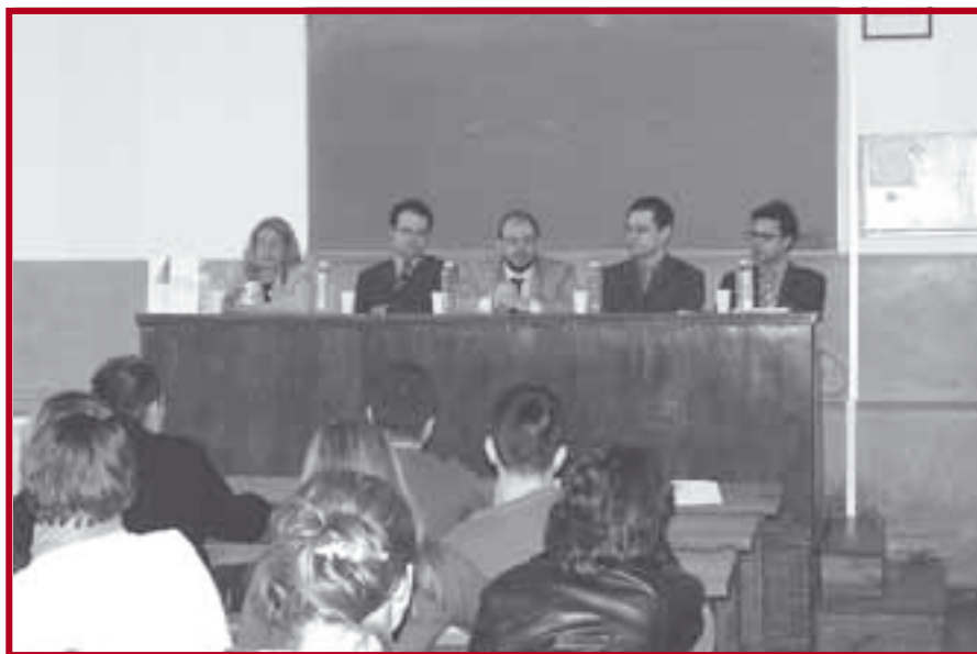
Са округлог стола на тему „Завршавам права... шта даље?“

вршетка студија до позиција на којима се сада налазе. Сви су се сложили да се са активним приступом и темељним планирањем властите каријере мора почети од прве године студије. Успех на факултету је битан, али не и пресудан, јер се подједнако, ако не и више, цени ангажованост у ваннаставним активностима. Волонтирање у невладиним организацијама, стручна пракса у предузећима и хонорарни послови током лета веома су значајни за студенте, јер на тај начин усавршавају своја знања и вештине, али тиме добијају и прилику да стечено знање примене у пракси. Тек кроз практичан рад можете заиста упознати себе, схватити који вам посао највише одговара и од многобројних опција за развој каријере изабрати најбољу. Истовремено, тиме се шири круг познаника и сарадника, што је веома битно. Такве ставке у биографији стварају позитивну слику о вама као о амбициозној, вредној и преданој особи, спремној на рад и стално усавршавање.