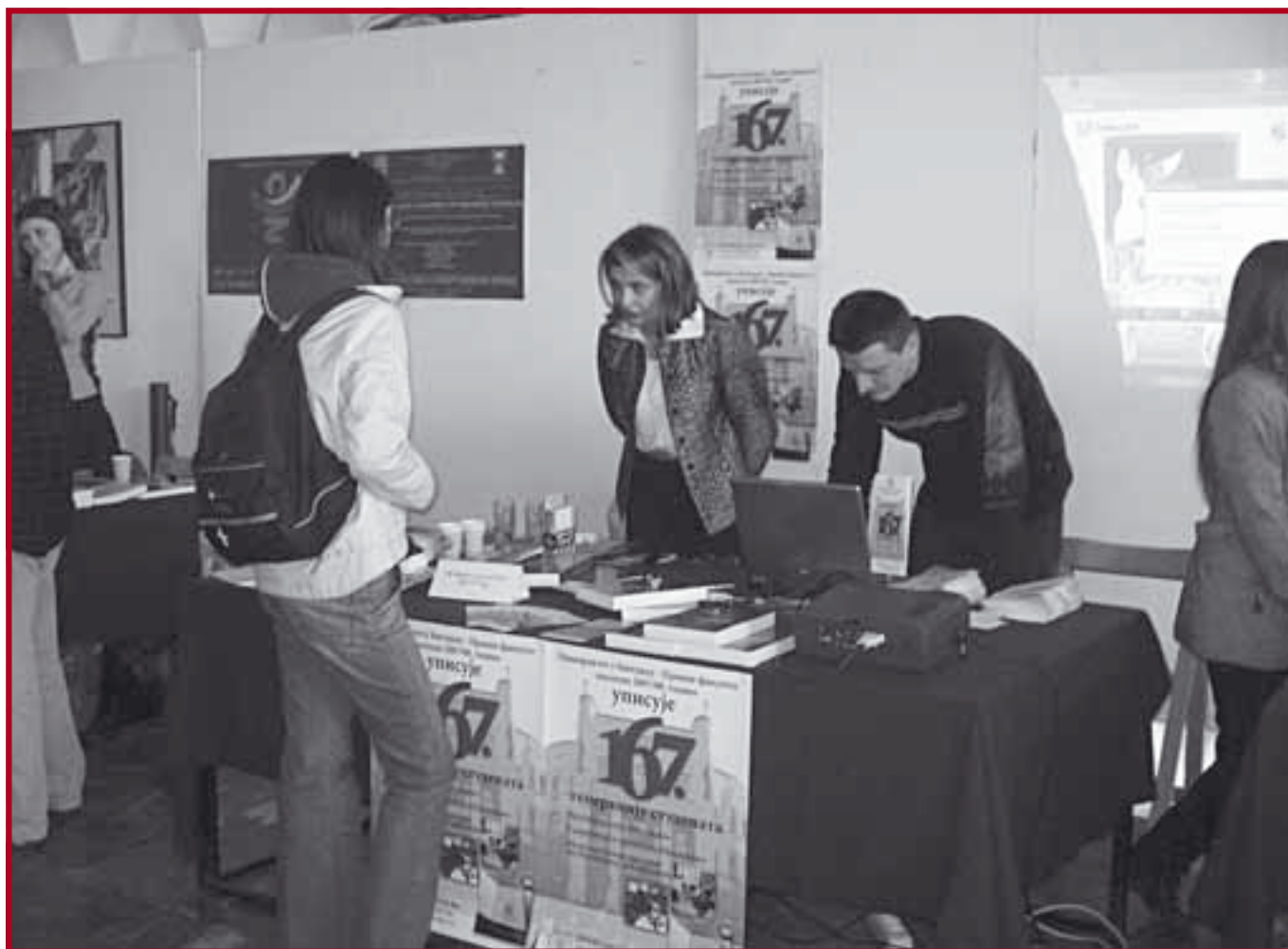
Са презентације нашег Факултета у Чачку

На сајту Факултета, за будуће студенте налазе се све остале информације у вези припремне наставе и материјала за упис у прву годину студија. ■