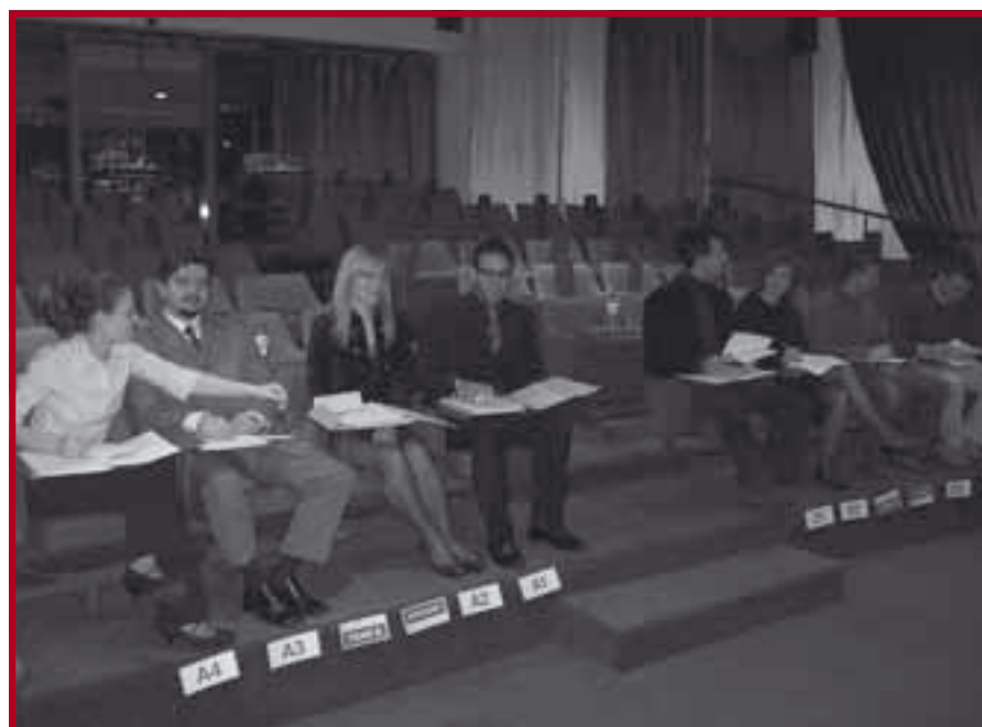
Наши студенти на такмичењу Balkan Case Challenge

Balkan Case Challenge полази од те, све актуелније, потребе да се студенту укаже прилика да своје знање стечено током основних сту-дија примени на измишљени случај и опроба се у улози авоката или економског експерта. Два тима која су прошла у финале law moot court