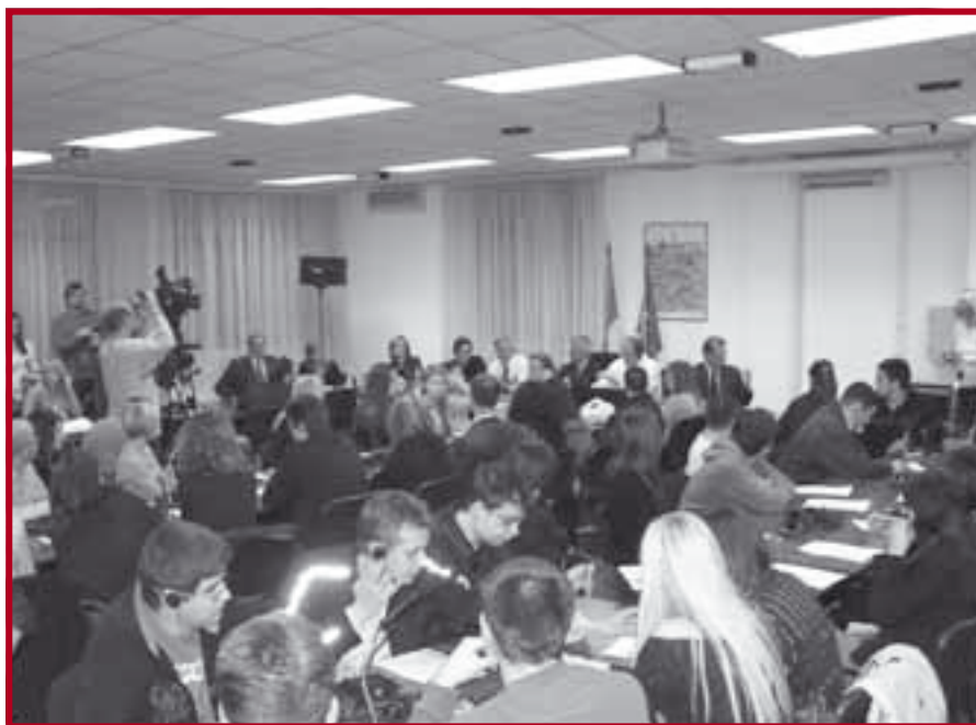
Са трибине „Србија, регионална безбедност и НАТО“