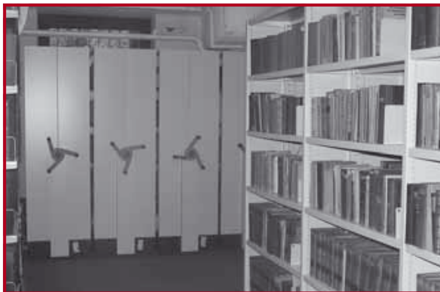
Нови изглед магацина библиотеке на Правном факултету

У јуну, јулу, августу и септембру 2007. године књижни фонд Библи-