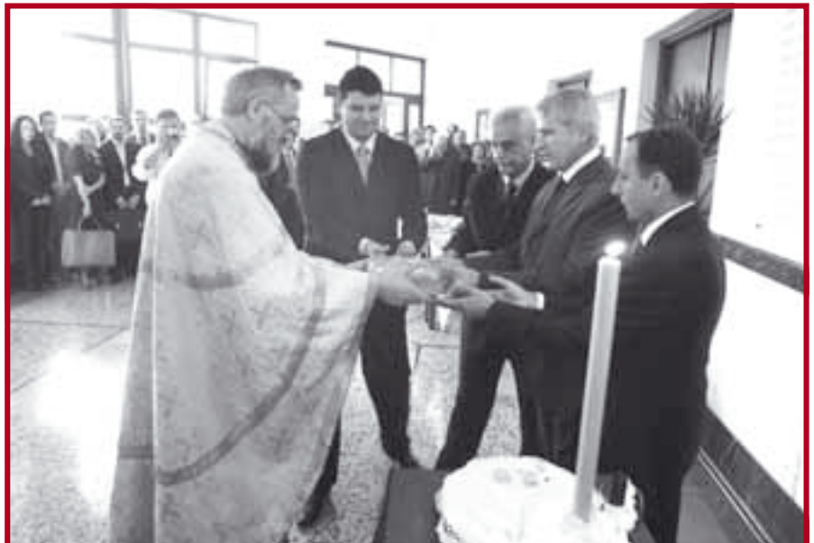
Прослава факултетске славе – Крстовдана