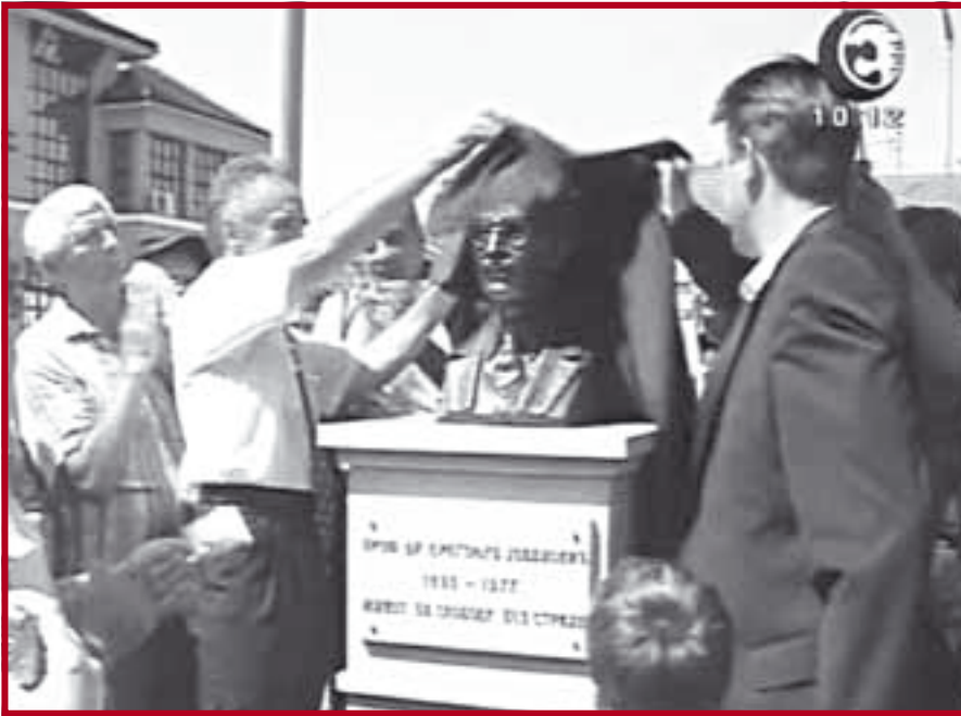
Откривање бисте проф. др Драгољуба Јовановића

гурно је најзначајнија политичка личност у историји Пирота и један од највећих интелектуалаца свога доба. Предратна власт га је прогањала због његових левичарских ставова, а послератни комунистички режим га је осудио на деветогодишњу робију, због његових тврдњи да је будућност земље у вишепартијском систему и тржишној економији. Умро је 1977. године у Београду. Процес за његову рехабилитацију још увек је у току.