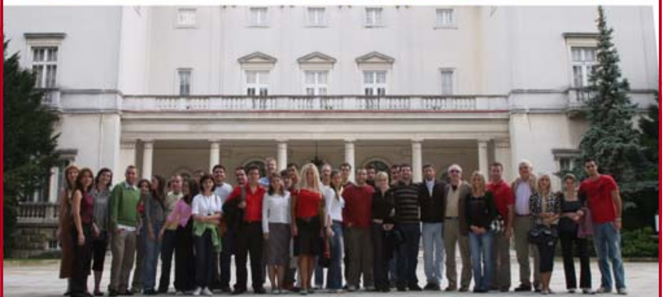
Полазници Летње школе о европским интеграцијама