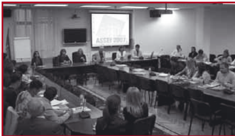
Са отварања Летње школе – ASSEI 2007. на нашем Факултету

ASSEI летња школа организована је у периоду од 10. до 21. септембра,