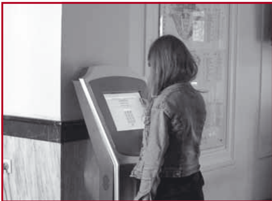
Инфо-киоск на Факултету

На IX седници Изборног већа Правног факултета Универзитета у