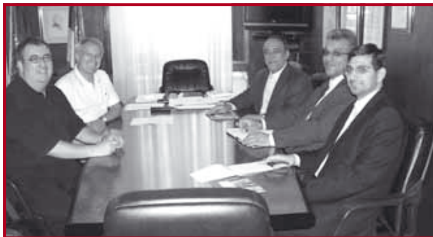
Делегација амбасаде Ирана у деканату

У периоду од 10. до 13. септембра 2007. године делегација Прав-