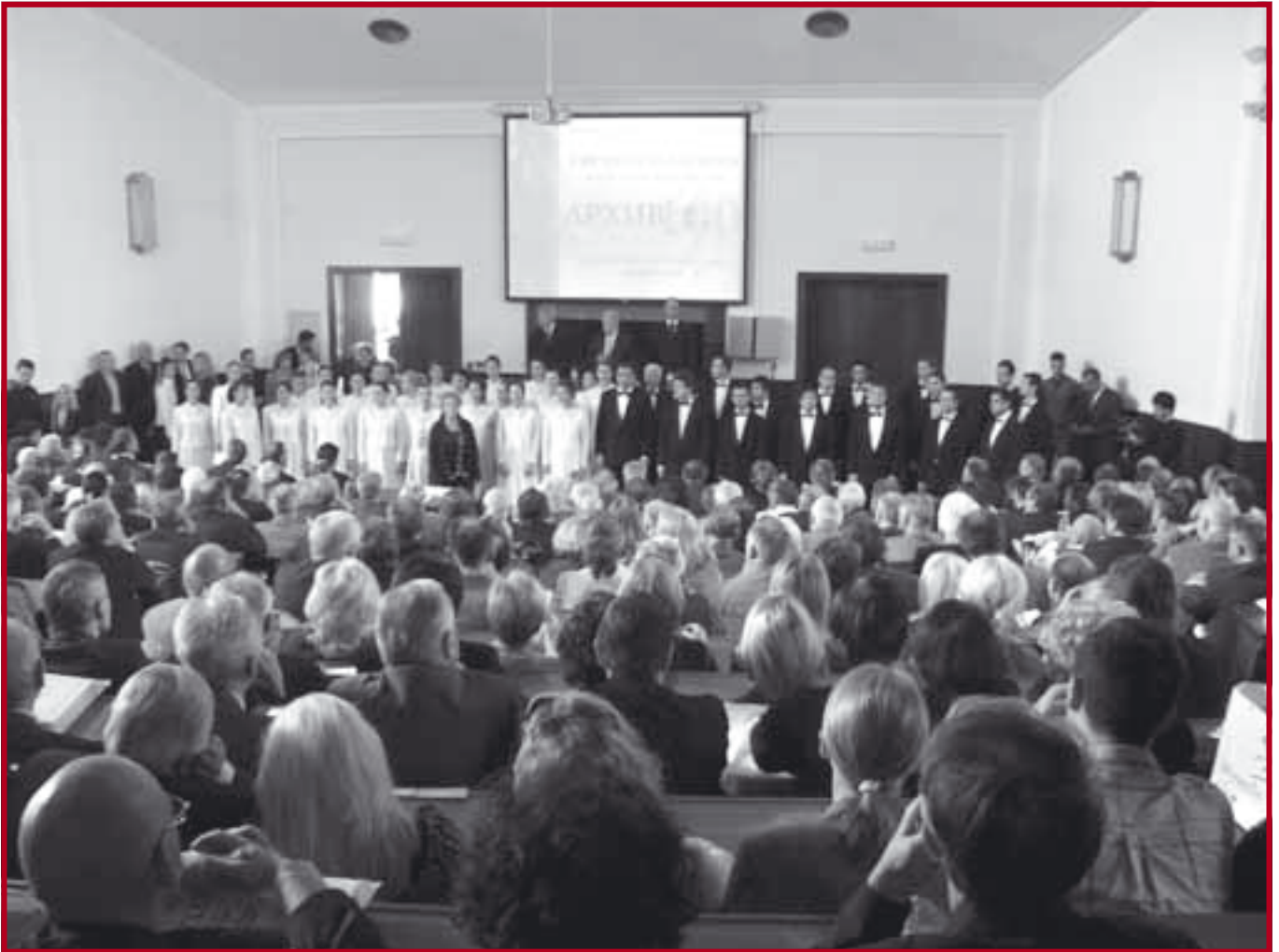
Са прославе јубилеја часописа Архив за правне и друштвене науке

Академији су присуствовали многобројни гости и сарадници часописа са правних и других факултета из региона, из научних и правосудних институција, адвокатске