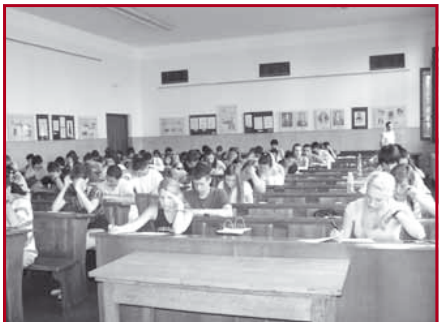
Са пријемног испита

28. јуна 2007. године на Правном факултету Универзитета у Београду одржани су пријемни испити за упис на прву годину студија. За