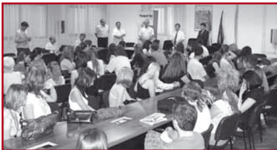
Свечана додела диплома полазницима курса

Сваке године почев од 1945., Европски форум Алпбах организује интердисциплинарне конгресе у планинском селу Alpbach (Тирол-