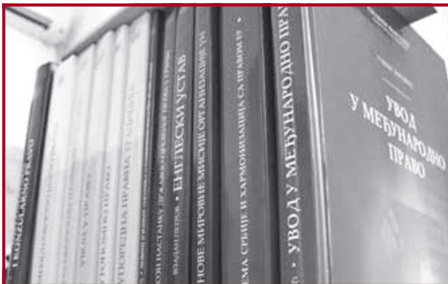
Нова издања Центра за публикације Правног факултета

Центар за публикације Правног факултета Универзитета у Београду објавио је у протекла три месеца следеће књиге: