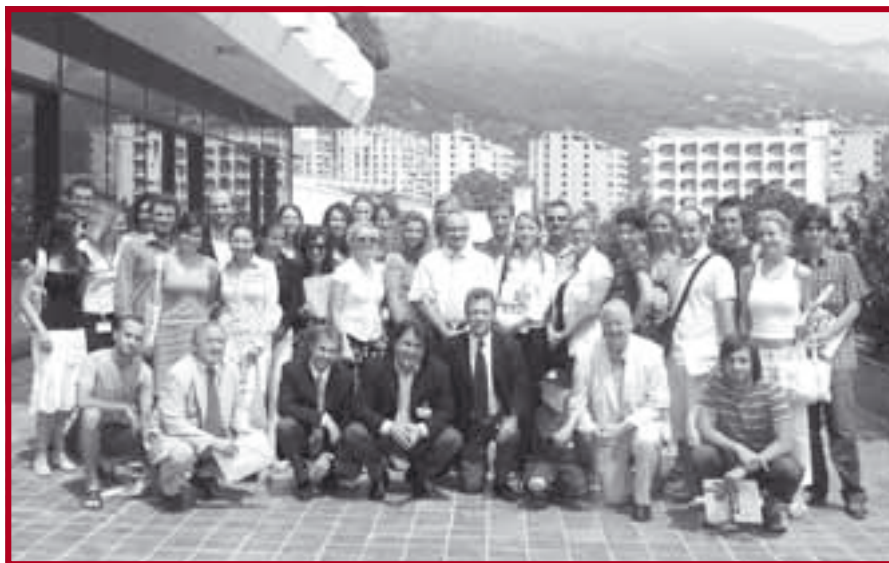
Полазници Летње школе у Игалу

Правни факултет Универзитета у Београду ( www.ius.bg.ac.yu ) у сарадњи са Johns Hopkins Центром за уставне студије и демократски развој Универзитета у Болоњи ( www.ccsdd.org ), организовали су у периоду од 23. до 27. јула 2007. године Пету летњу школу у Игалу са темом „Европска унија и правне реформе“. Предавања и одређени број case-study -а везаних за све гране права у Европској унији привукао је и ове године велику пажњу. Тридесетак полазника, млађих правника и политиколога из бројних европских земаља (Албанија, Белорусија, Литванија, Чешка Република, Словачка, Србија, Италија, Бугарска, Босна и Херцеговина, итд.) пратило је на енглеском