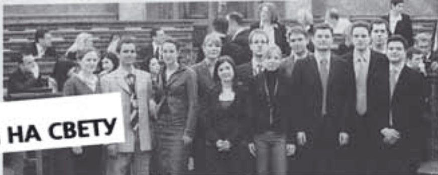
ЕКИПА Наши тим пред међународно такмичење

УСПЕХ БЕОГРАДСКИХ СТУДЕНАТА ПРАВА У БЕЧУ