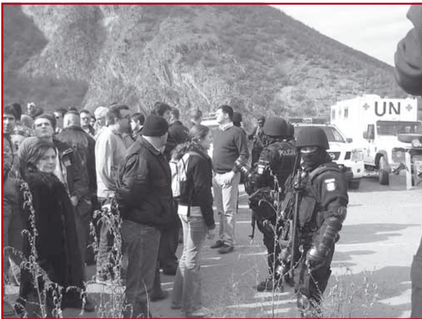
Студенти на административном прелазу Јариње (1)

политичких наука), као и невладином организацијом Активни центар, студенти београдског Правног факултета су се одлучили на миран протест дан по проглашењу независности како би се осудио овај противправни чин и како би се из-