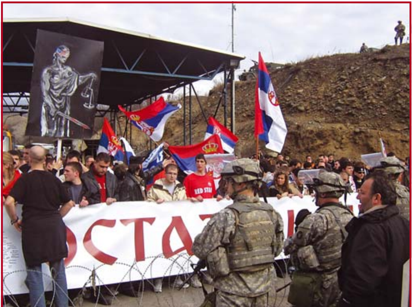
Студенти на административном прелазу Јариње (2)

У петак 22. фебруара 2008. више стотина студената Правног факултета кренуло је пут Косовске Митровице да искажу подршку својим колегама после једностраног проглашења независности Косова, заједно са студентима Пољопривредног, Саобраћајног, Учитељског факултета, Факултета орагнизационих наука и више наставника. Путовање је било организовано и припремљено, добијено је одобрење међународне управе за несметани улазак на Космет и потврђено је пре поласка. Ипак, колона од седам дуплих аутобуса са студентима заустављена је на административном прелазу Јариње. Део студентских аутобуса је прошао пункт UNMIK полиције али је заустављен од KFOR-а мало даље на другом