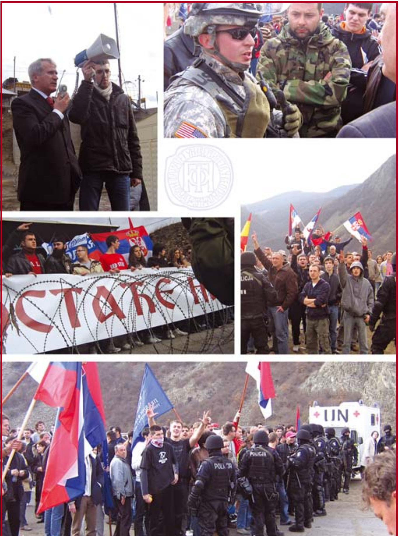
Миран протест студената и наставника Правног факултета Универзитета у Београду и других факултета из Србије на административном прелазу Јариње