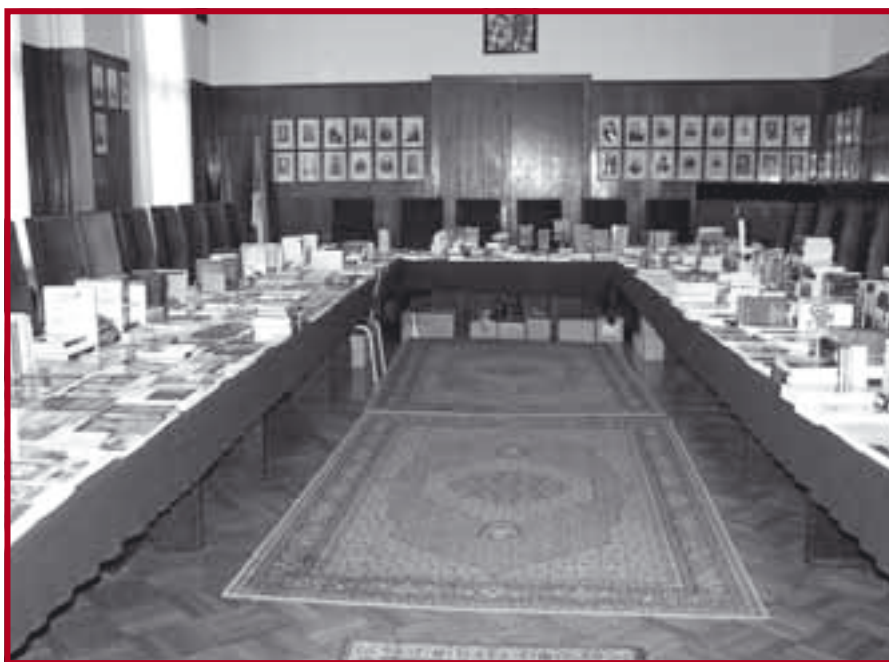
Продајна изложба издања The English Book

Веб линк за овај портал је постављен на насловну страну веб сајта Факултета, а сајт ће се редовно допуњавати новим садржајима. ■