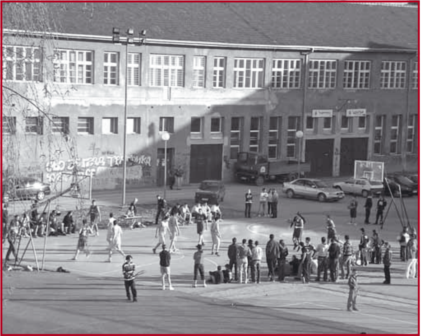
Студенти на пријатељској кошаркашкој утакмици у Косовској Митровици