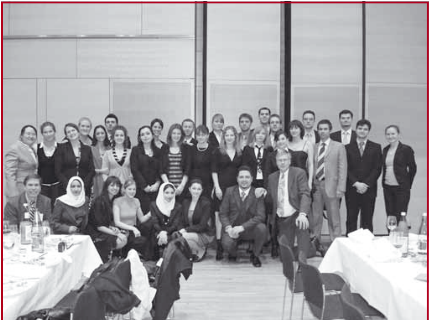
Тим Правног факултета са колегама из Питсбурга, Кијева, Бахреина и Приштине на свечаном затварању такмичења Willem C Vis International Commercial Arbitration Moot