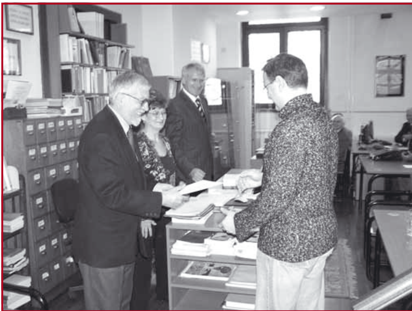
Са свечане доделе захвалница дародавцима наше Библиотеке

Институције: Архив Србије и Црне Горе; Београдска берза, ПР и маркетинг; Комисија за хартије од вредности; Министарство правде Републике Србије; Народна библиотека Србије; Правен факултет Јустинијан Први, Скопље; Правна факултета Универза в Марибору; Правни факултет Универзитета у Бања Луци; Правни факултет Универзитета у Новом Саду; Универзитетска библиотека Светозар Марковић у Београду; Фонд за хуманитарно право; Центар за слободне изборе и демократију (ЦеСИД).