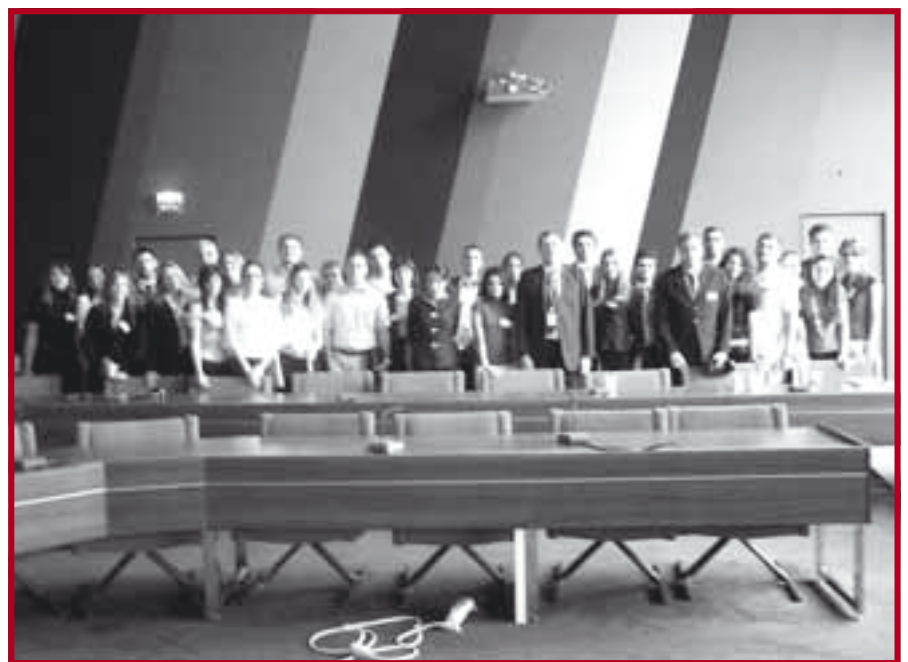
Наши студенти у Савету Европе

публике Србије и других држава чланица Савета у области очувања демократије, владавине права и заштите људских права. Посета СЕ окончана је присуством церемонији уручења поклона наше државе СЕ поводом председавања Србије Комитетом министара СЕ, од маја