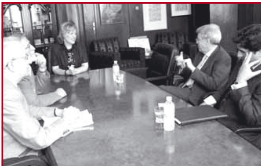
Шпански амбасадор у разговору са професорима кривичног права нашег Факултета