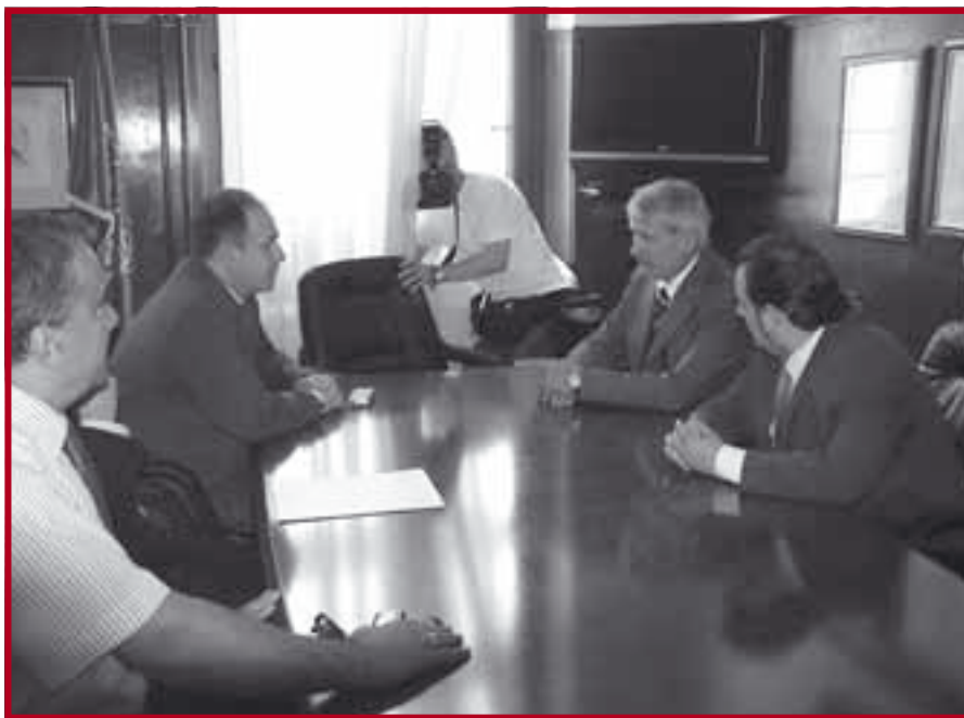
Министар Зоран Лончар у посети нашем Факултету

пројекте на којима ће Министарство и Факултет сарађивати у наредном периоду.