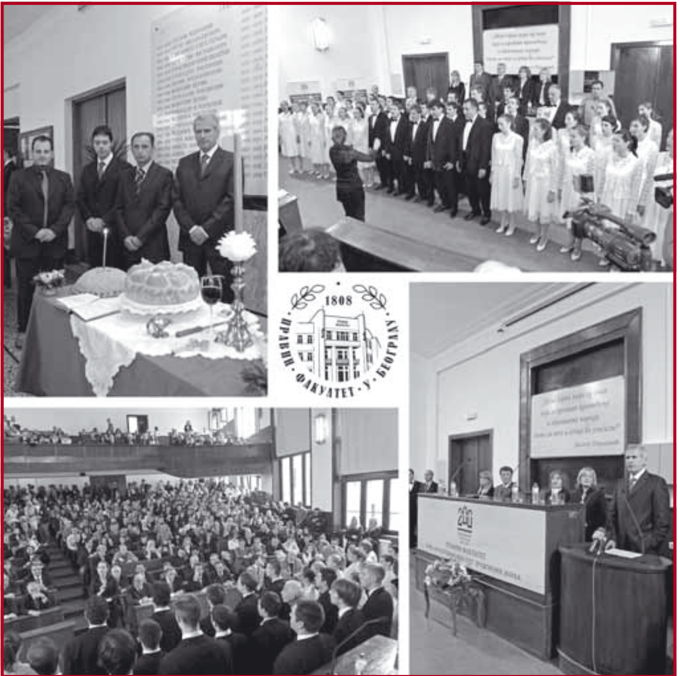
Прослава Дана и Славе Факултета