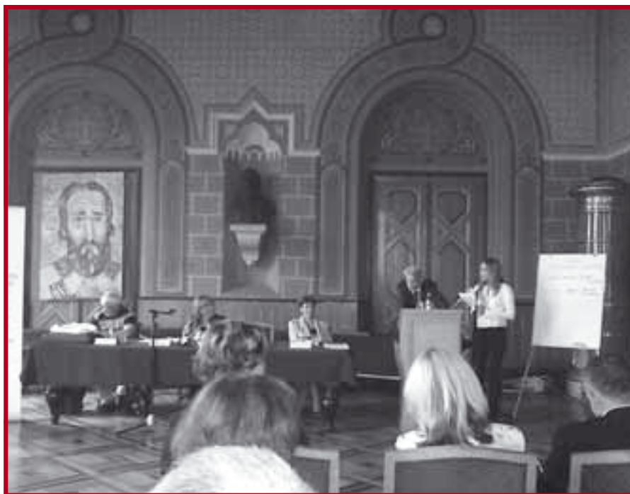
Са међународног скупа Европска заједница народа и универзалне вредности