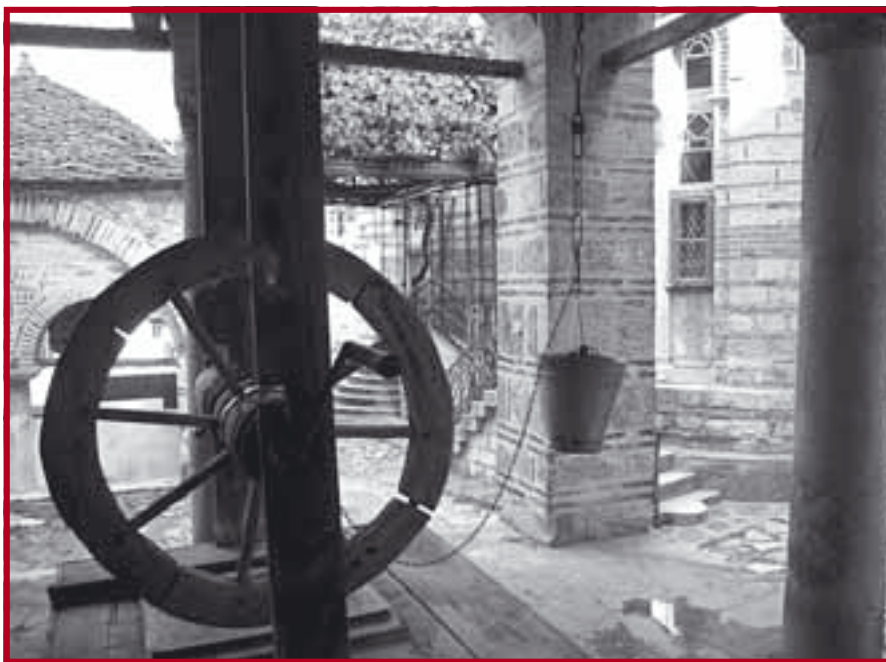
Савин бунар и чудотворна лоза Светог Симеона