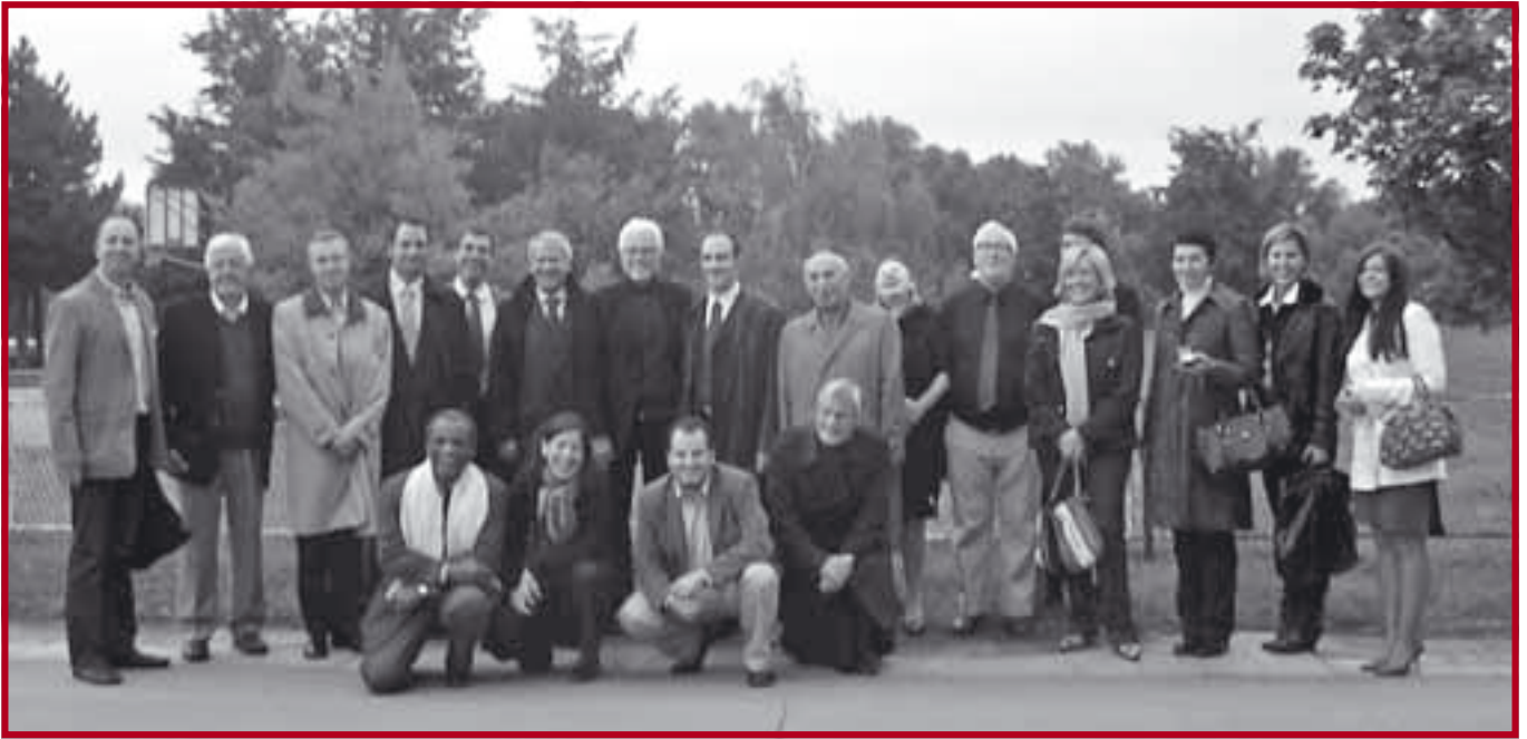
Учесници Конференције на Уићу

вић, који је још једном поздравио све госте и захвалио им се на доласку, као и на успешним презентацијама и активној и конструктивној дебати. На самом крају, сви учесници су изразили задовољство радом Конференције, организа-