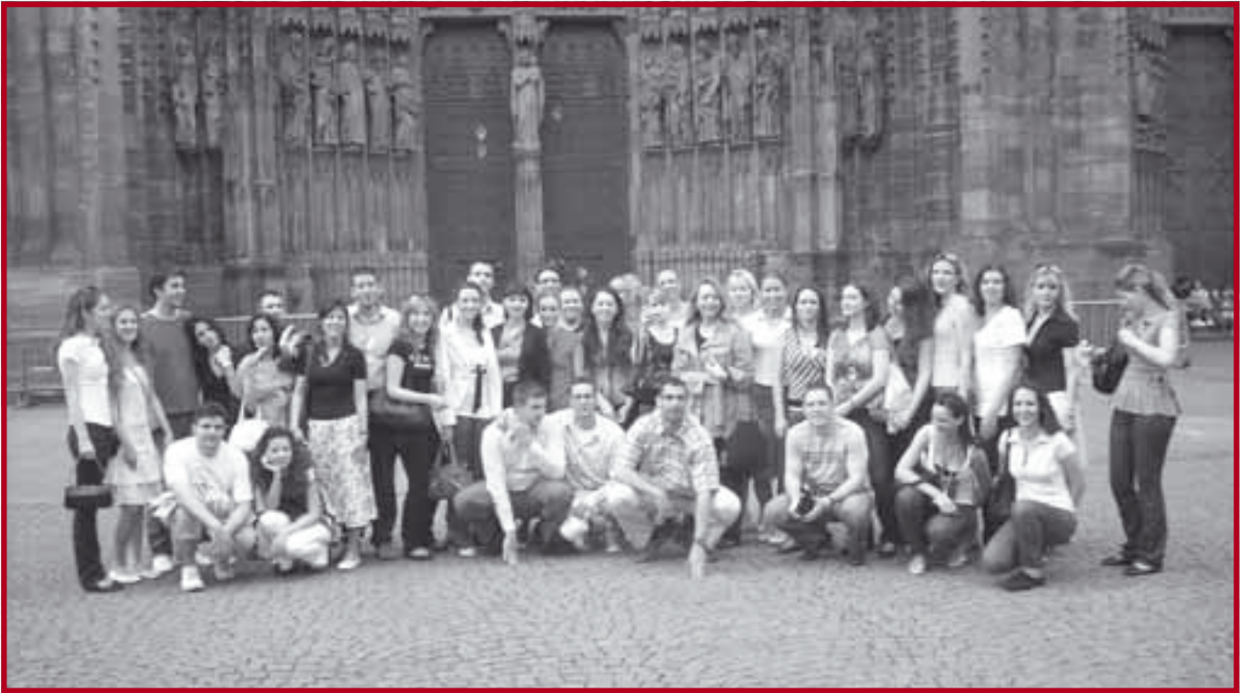
Студентска делегација Правног факултета испред катедрале Нотр Дам у Стразбуру

укључујући нове пројекте студијске групе за Европско право, који се тичу очувања архитектонског наслеђа и амбијенталних целина, као и унапређења религијске димензије међукултурног дијалога у Републици Србији.