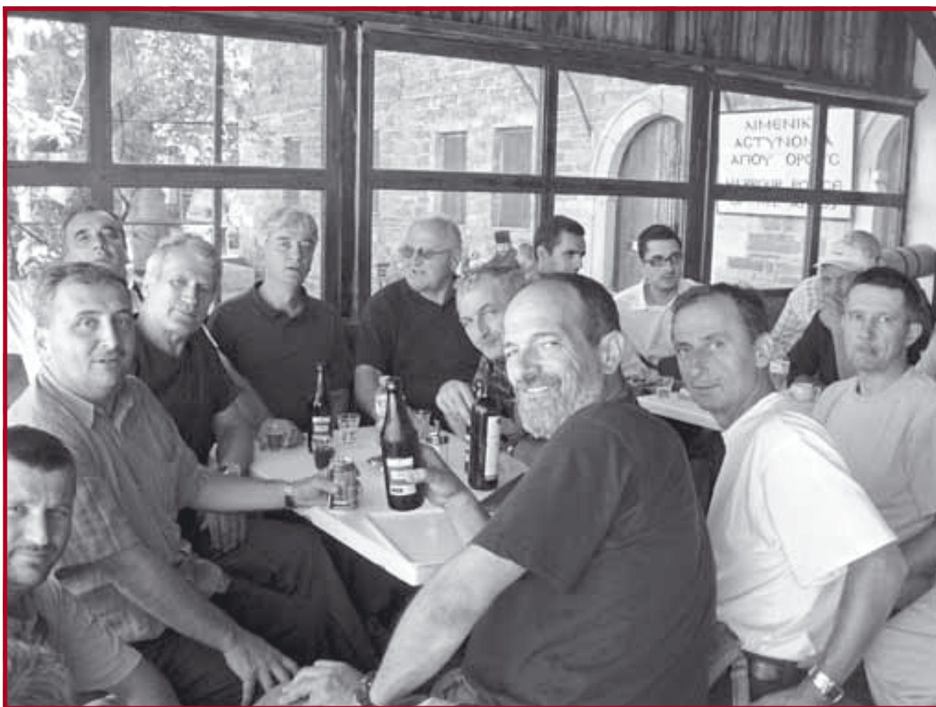
Чекајући брод у луци Дафне

У Кареји, као административном центру Свете Горе, сви манастири имају своје конаке у којима бораве њихови званични представници, па тако постоји и Хиландарски конак . Смештен је високо изнад овог насеља, и до њега води стрми путељак који пролази поред Савине