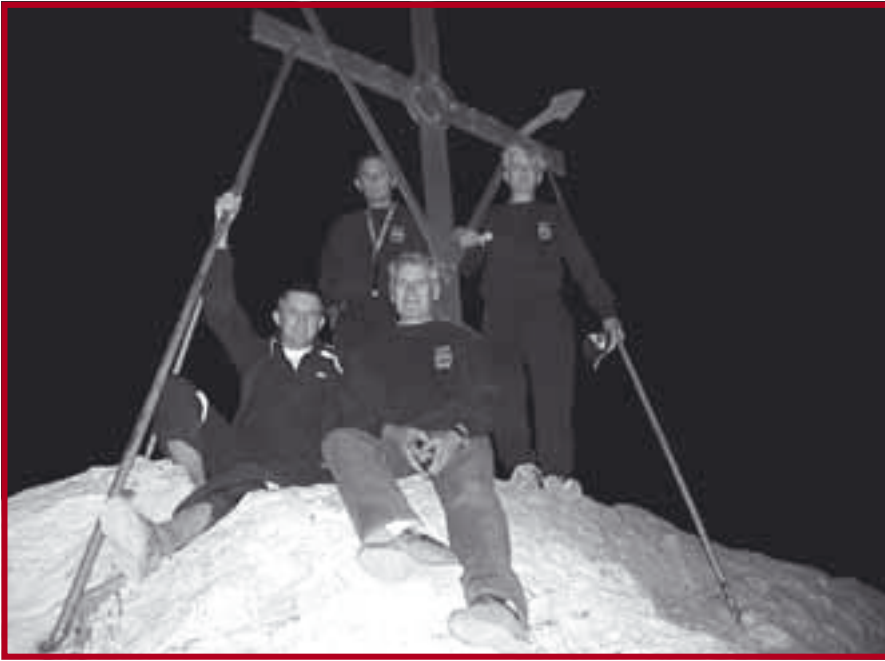
На врху Атоса

противника планински масив, који по њему доби име, пркосно из-рањајући из Јонског мора. Неписано је правило да сваки монах бар једном у животу треба да се успне до овог места. То је у младости учинио и Свети Сава, о чему сведочи запис Доментијана: „И обишавши свуда свети врх (Атоса), и сагледавши на падинама Горе и у њезину подножју многе испоснике, сишавши са Горе испитао је њихов најсуровији живот, и видевши њихово пустињачко и безметежно живљење, чудаше се и весељаше се и у души узросташе што удостоји видети такве божје људе“.