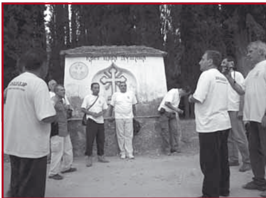
Крст Цара Душана

Новчаним прилогом желели смо да скромно, бар симболично, припомогнемо обнови Хиландара. Чули смо да донације долазе са разних страна, од институција и појединаца, а из државног буџета се годишње издваја милион евра. Охрабрује нас присуство високих кранова и велики број радника који у журбано промичу по скелама. Један конак на самом улазу већ је обновљен, а у његовом приземљу смештена је књижара. Изван зидина је изграђен вишеспратни конак за смештај гостију, лепе спољашности, у старинском стилу, али опремљен свим што је путнику намернику неопходно.