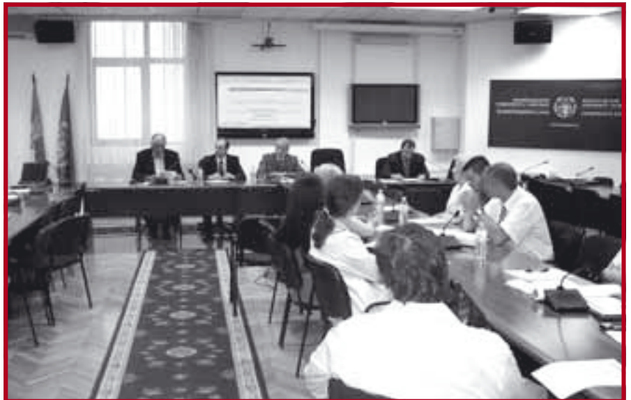
Темпус експертски семинар на нашем Факултету