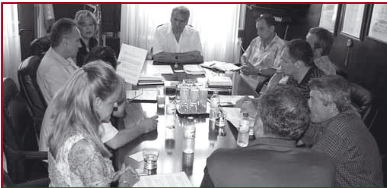
Са потписивања уговора о сарадњи Правног Факултета и РТС-а

За упис на прву годину студија Правног факултета Универзитета у Београду, за школску 2008/09. годину конурисало је 1632 кандидата. За упис је одобрено 1500 студената од чега 600 на терет буџета и 900 на самофинансирање. Пријем докумената у првом конкурсном року обављен је у периоду 25–27. јуна 2008. године, а пријемни испит је полагао 30. јуна 2008. године. Максималан број бодова на пријемној листи (успех из школе плус успех на пријемном) износио је 98 поена, колико има пет првопласираних кандидата. Последњи студент уписан на терет буџета имао је 70,70 бодова. Пријемни у другом конкурсном