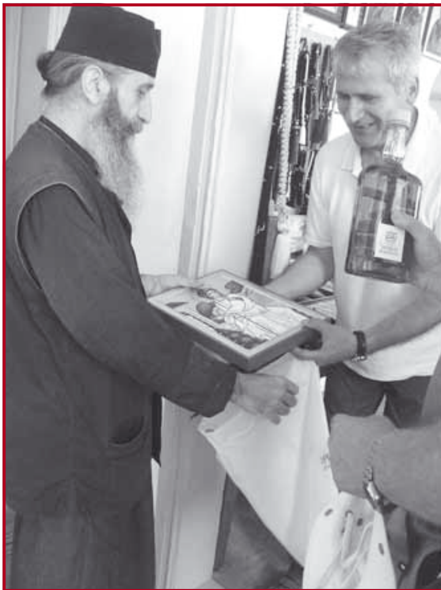
Даровање монасима у Великој Лаври

Успињемо се стрмим каменим ходником кроз три узастопне заштитне капије манастира Велике Лавре, и пред нама се указује нешто попут омањег средњовековног града. Унутрашњи простор манастира испуњен је мноштвом зграда, пролаза, уличица, а свуда унаоколо су високе зидине са многобројним кулама. После провере наших докумената, по древном обичају домаћини нас послужују ратлуком, узом и кафом, а ми узвраћамо поклонима које смо понели са собом (икона Белог анђела и домаћа ракија). Смештају нас у необично уредне гостинске собе, где упознајемо посетиоце пристигле са неких других меридијана. Дрвена клепала нас предвече позивају на службу, током које монаси и верници прелазе из католикона у трпеза-