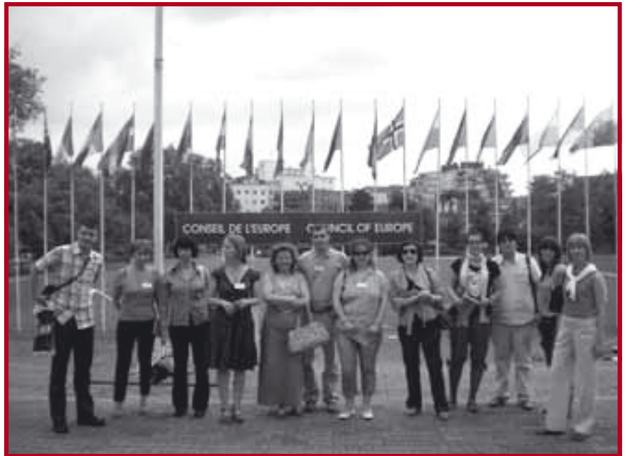
Студенти Високих европских студија испред Савета Европе