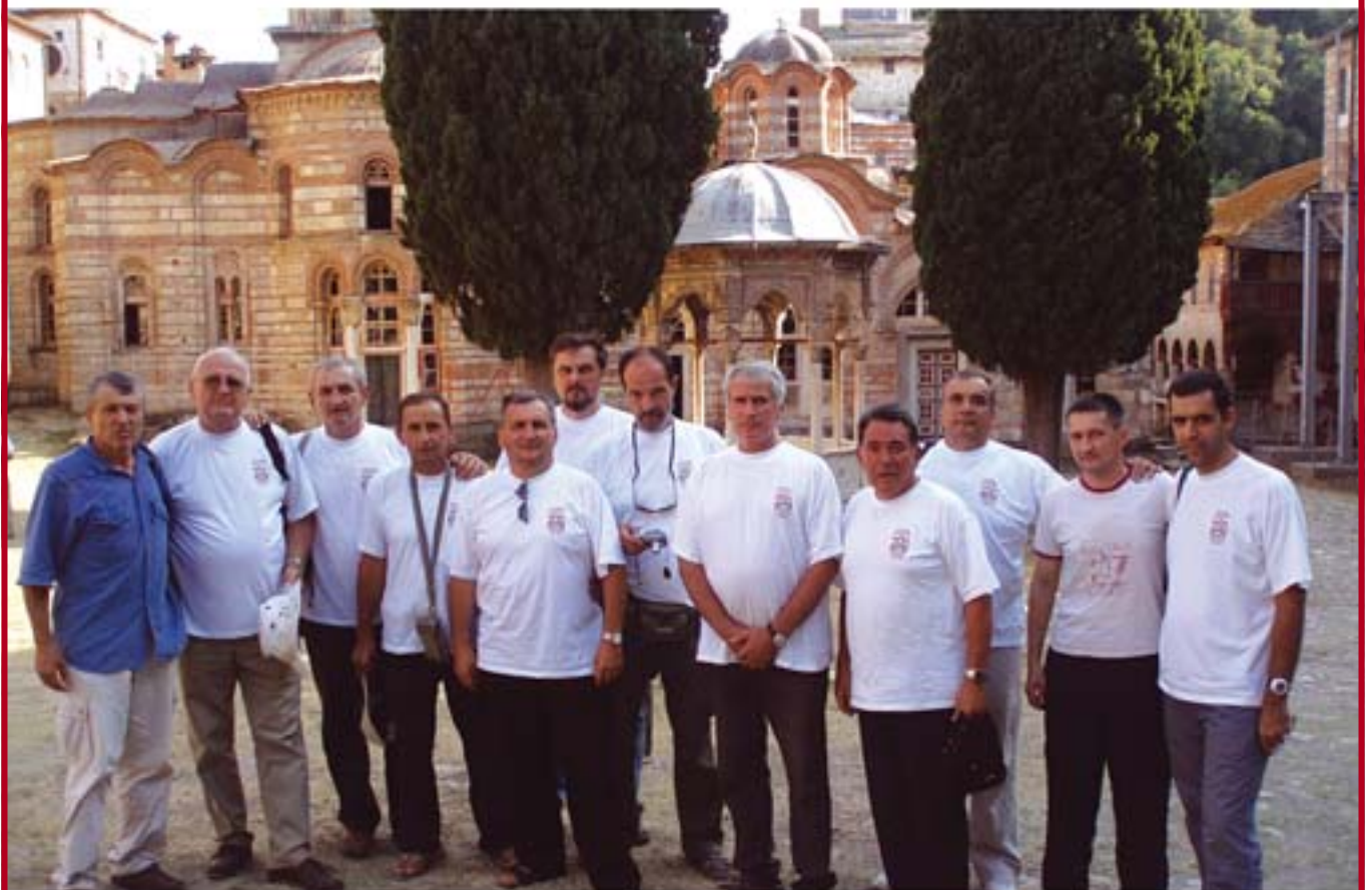
На Велику Госпојину у Хиландару