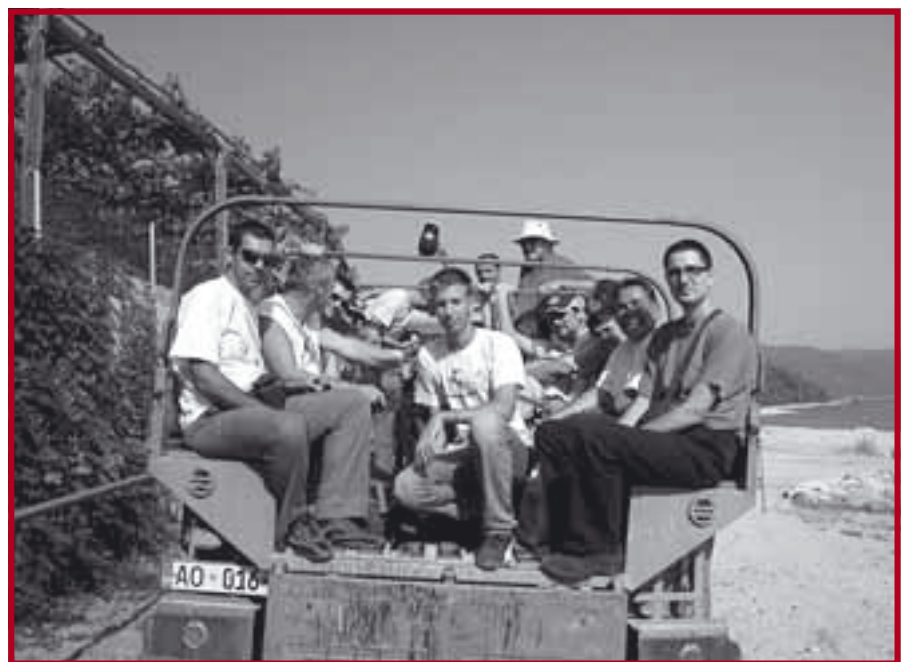
Приближавамо се Хиландару

Уз помоћ два приватна комбија, наручена преко мобилног телефона, и после вишечасовног трузкања по прашњавим путевима, нашли смо се на супротној (источној) страни полуострва, у главној светогорској луци Дафне. Одатле про-дужавамо трајектом до Јованице, хиландарске арсане, где нас сачекује стари војнички камион нашег манастира, у који смо се укрцали и опет упутили на супротну (западну) страну полуострва, у правцу Хиландара . Сасвим у даљини указује се планински масив Атоса, али они који су се на њега пели не могу ни сами да поверују да су само не-