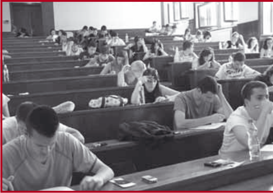
Са пријемног испита

року одржан је 4. септембра и на њега је изашло осам кандидата држављана Републике Србије који су средњу школу завршили у иностранству. Укупни број уписаних студената у школској 2008/09. години је 1512 студената (1500+ 11 странаца (из Црне Горе, Словеније и Грчке) +