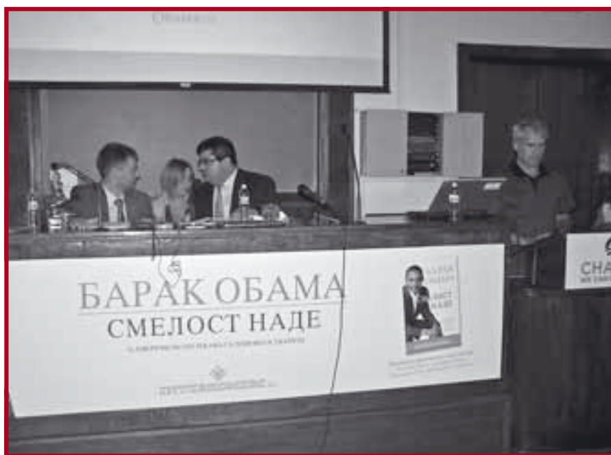
Са промоције књиге Барака Обаме