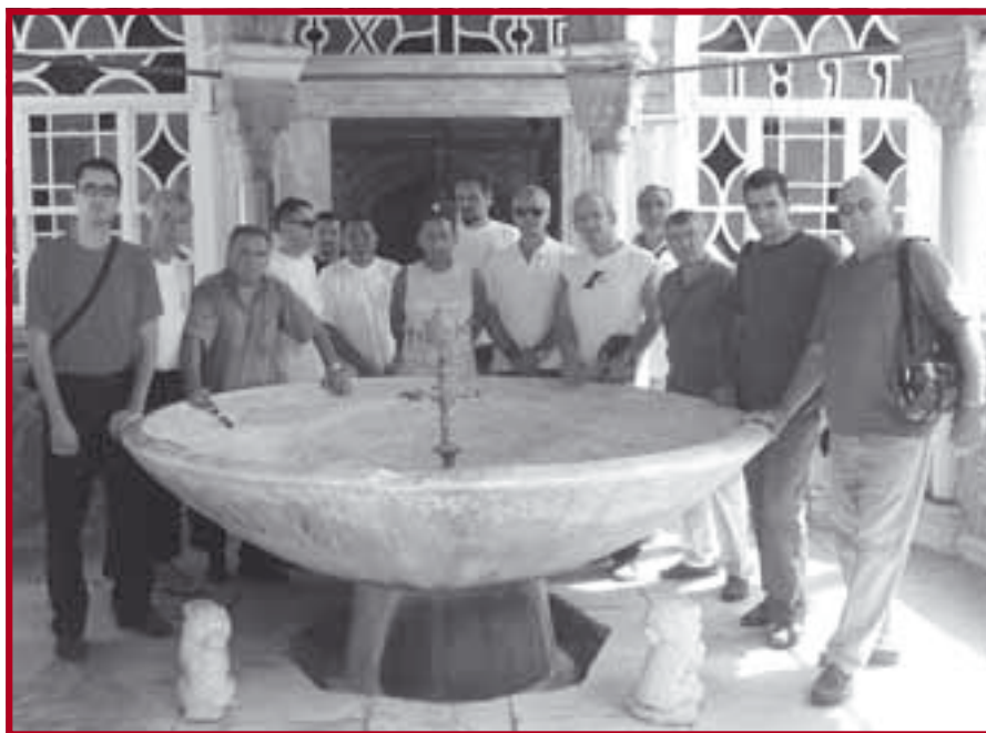
Испред крстионице у Великој Лаври

ради о царској задужбини, а огромни кипарис поред ње подсећа нас на њеног оснивача, Светог Атанасија Атонског, који га је ту наводно засадио. Његовом заслугом успостављена је у Лаври прва монашка заједница светогораца која је прихватила „општежиће“ (киновију), засновано на колективном животу, раду и молитви, уз одрицање од свих својих добара. До тада су преовлађивали усамљени пустињаци, аскете, тек понегде организовани у „особножиће“ (идиоритмију), лавбаву заједницу монаха који се самостално хране, поседују своју имовину, живе у издвојеним келијама, поштујући правила која сами себи одређују, и само о празницима се окупљају да би обавили заједничку службу. Ова два начина монашког живота вековима су постојала упоредо на Светој Гори, да би тек недавно „општешаје“ однео превагу. Оно почива на канонским правилима успостављеним тзв. типичима, неком врстом манастирских статута, од којих је први настао управо у Великој Лаври, из пера Атанасија Атонског, постајући узор за све касније. Због тога је овај манастир, поред своје