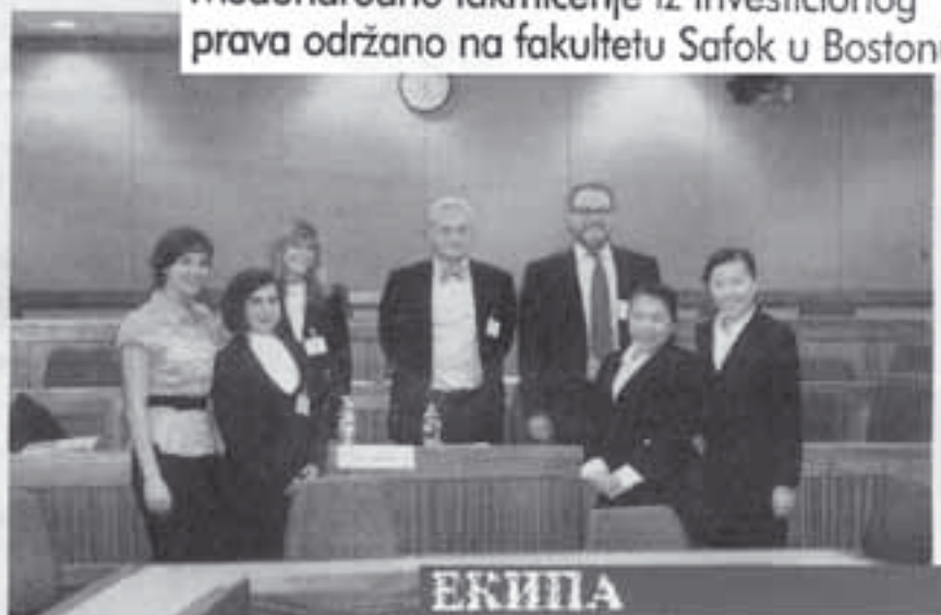
Такмичари на Универзитету Сафок