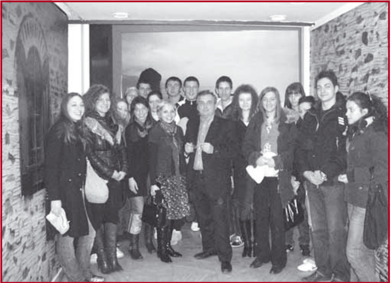
Хиландарска ризница у Музеју примењених уметности

студентима бројне утиске са тих путовања. Сутрадан је са групом студената посетио изложбenu поставку Ризница манастира Хиландара у Музеју примењене уметности у Београду.