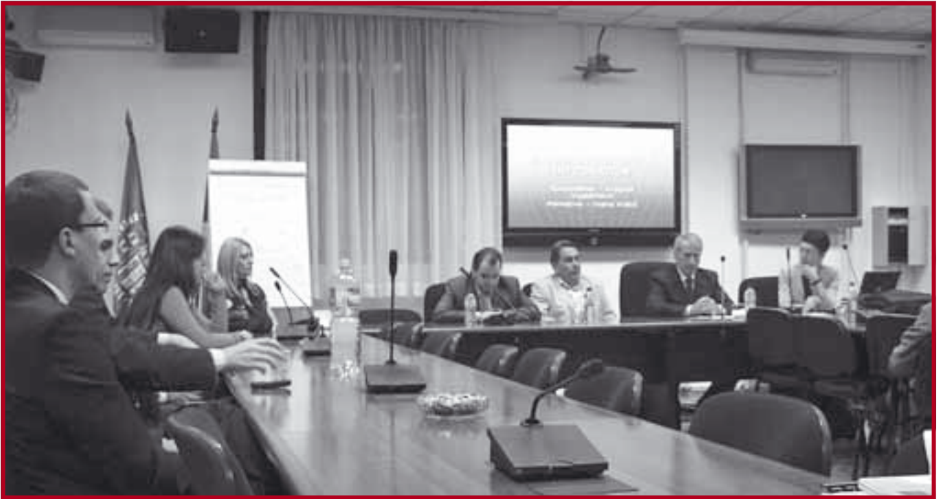
Са свечаности поводом отварања Мастер студија из европских интеграција