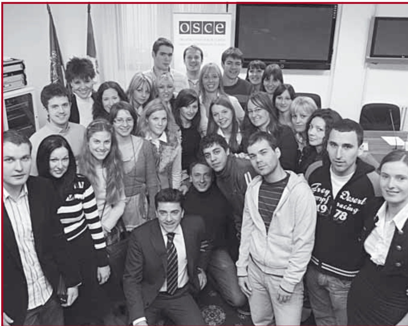
Полазници курса „Организовани криминалитет-појам, појавни облици и сузбијање“