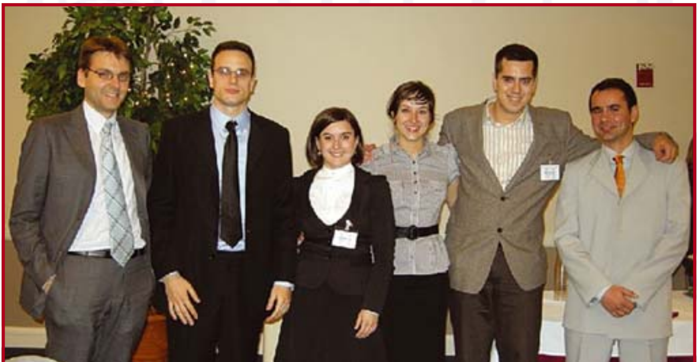
Они су освојили сребрну медаљу

мичења су: Центар за међународне правне студије, Салцбург, Аустрија; Правни факултет Универзитета у Суфолку, Масачусетс; Правни факултет Универзитета у Пепердину, Калифорнија; Центар за енергију, нафту и право руда Универзитета у Дандију, Шкотска и Немачки институт за арбитражу, Келн/Франкфурт, а подршку су им пружиле и реномиране међународне институције као што су УН комисија за међународно привредно право – UNCITRAL, Међународни центар за решавање инвестиционих спорова – ICSID, Међународна трговачка комора – ICC, Британски институт за међународно и упоредно право и др. Више о такмичењу види: www.fdimoot.org