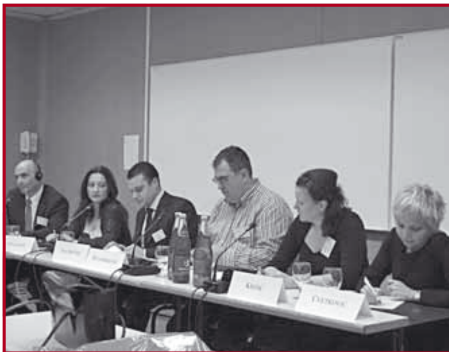
Представници Беча, Ниша, Скопља, Загреба и Београда на Конференцији у Бечу

Од 9. до 11. октобра 2008. године на Правном факултету у Бечу одржан је научни скуп Forschungen zur Rechtsgeschichte in Südosteuropa (Истраживања правне историје у југоисточној Европи) . Разлог