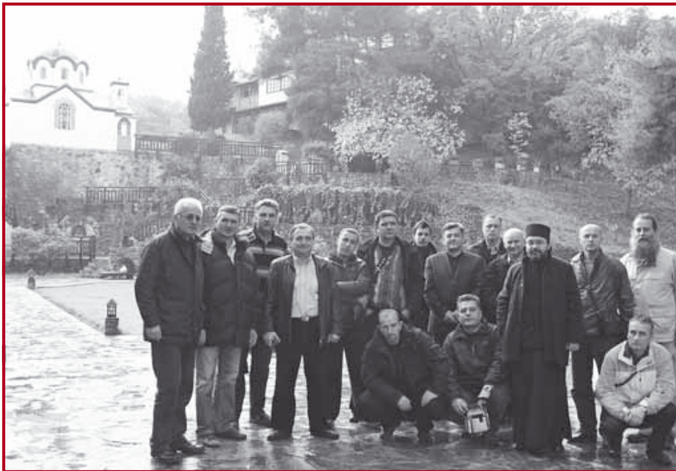
Хиландарски метох Каково