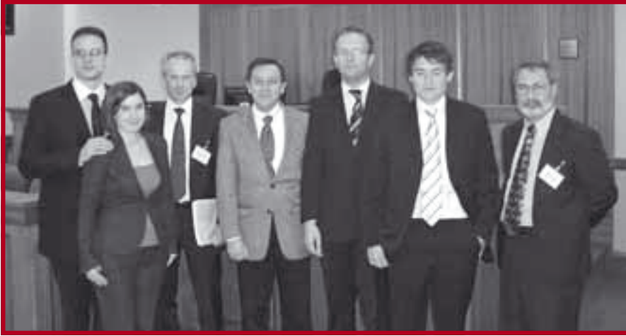
После наступа са тимом из Минесоте

место на усменом делу такмичења је са нашим тимом поделио Правни факултет престижног Њујоршког универзитета NYU (од четири полуфиналисте београдски тим је био једини са неенглеског говорног подручја), док је у укупном пласману наш тим неприкосновено други.