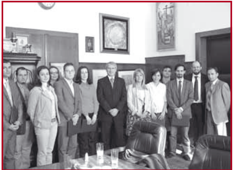
Са свечаности у Деканату

а другима поводом избора у исто, односно више звање.