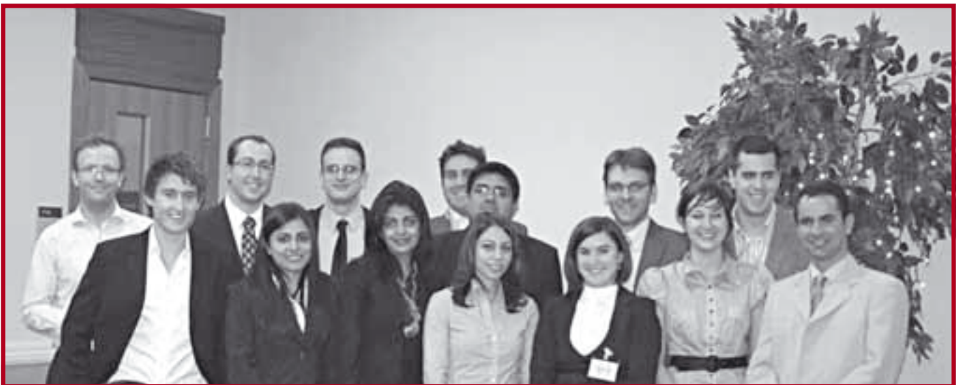
Полуфиналисти такмичења у Бостону

Учешће нашег тима на овом такмичењу, својим великодушним донацијама, обезбедили су: Међународна финансијска корпорација – IFC (Групација Светска банка), Raiffeisen банка, Министарство науке РС, Градски секретаријат за омладину и спорт града Београда, општине Врачар и Звездара, којима се Факултет и овом приликом срдечно захваљује. ■