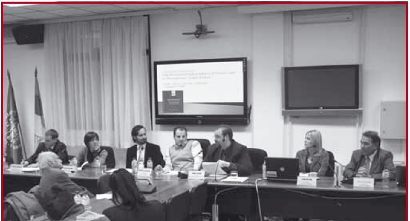
Учесници међународне конференције Self-Proclaimed Independence of Kosovo and its Recognition – Legal Aspects