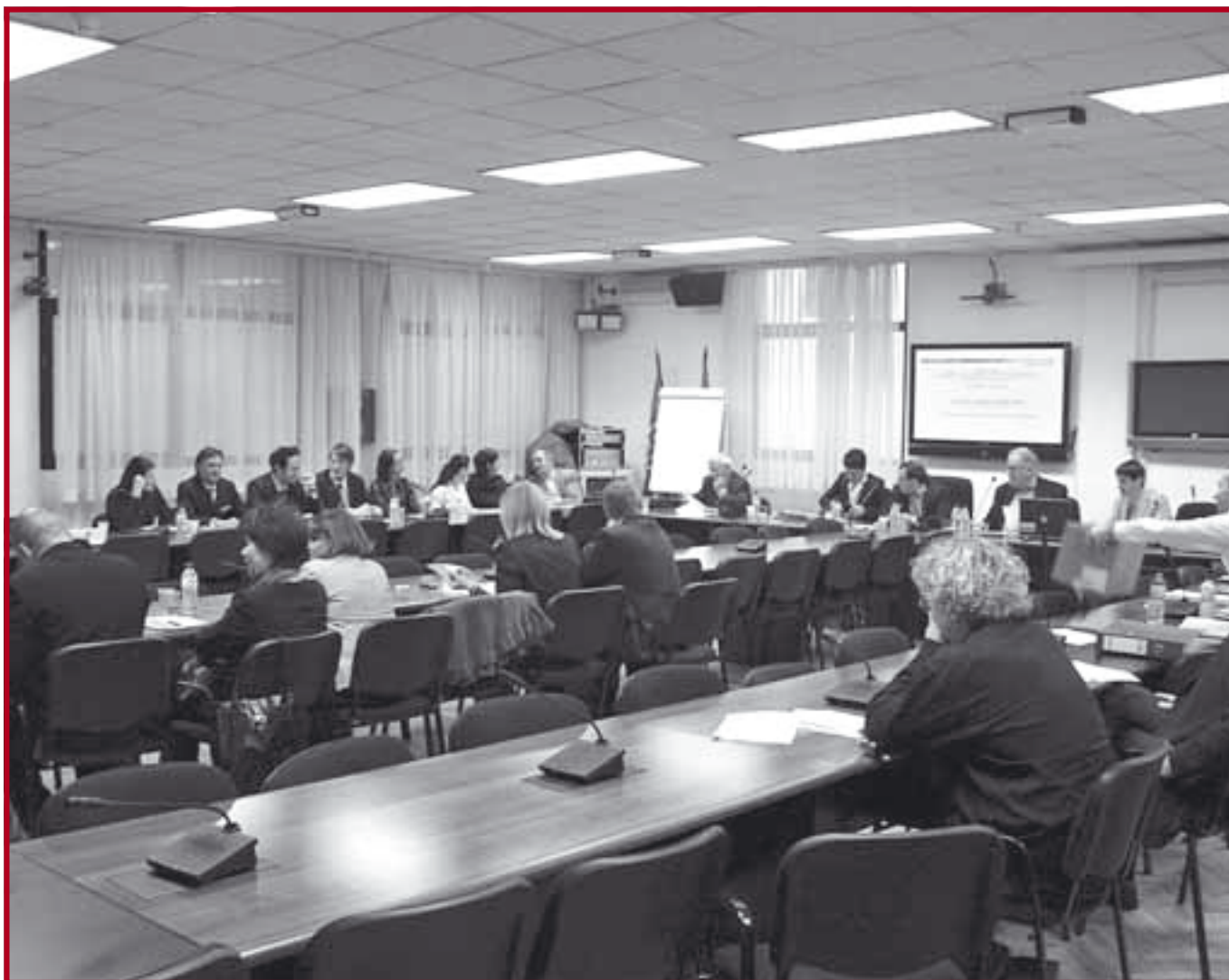
Са завршног Темпус састанка

Завршни Темпус састанак одржан је 13. и 14. новембра 2008. године. Састанку су присуствовали