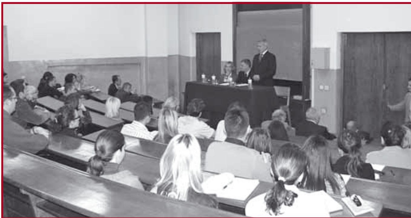
Са свечаности поводом отварања Мастер студија на Факултету