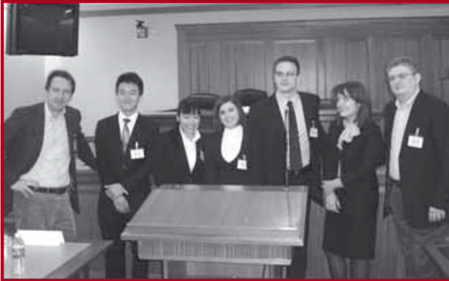
После наступа са тимом из Хонг Конга

Инвестиционо право и инвестициона арбитража су правне дисциплине у повоју које добијају све већи значај због растућег броја и све веће вредности страних директних инвестиција, растућег броја билатералних конвенција о заштити инвестиција које закључују државе широм света (процењује се да је до