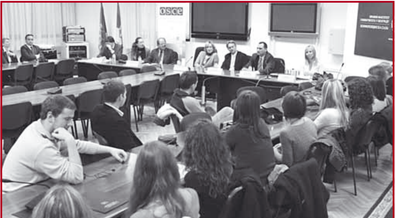
Са свечане доделе диплома на курсу „Организовани криминалитет-појам, појавни облици и сузбијање“

тет-појам, појавни облици и сузбијање“, намењен студентима Правног факултета.