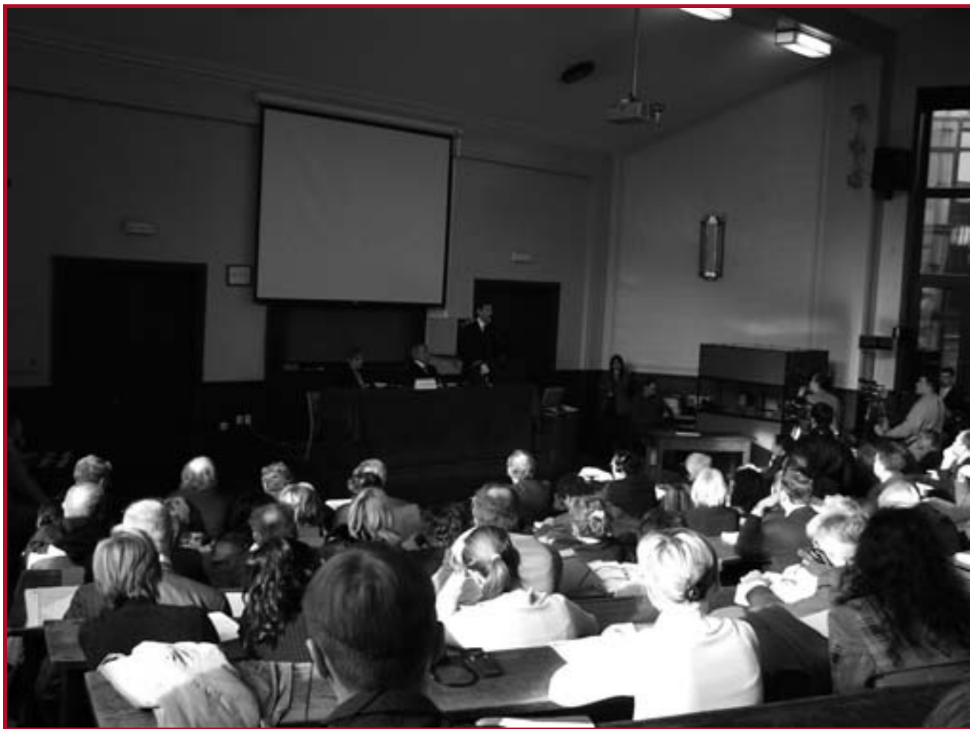
Министар др Слободан Вуксановић на отварању Конференције „Успосиљављање националној тима њромојера Болоњској њроцеса у Србији