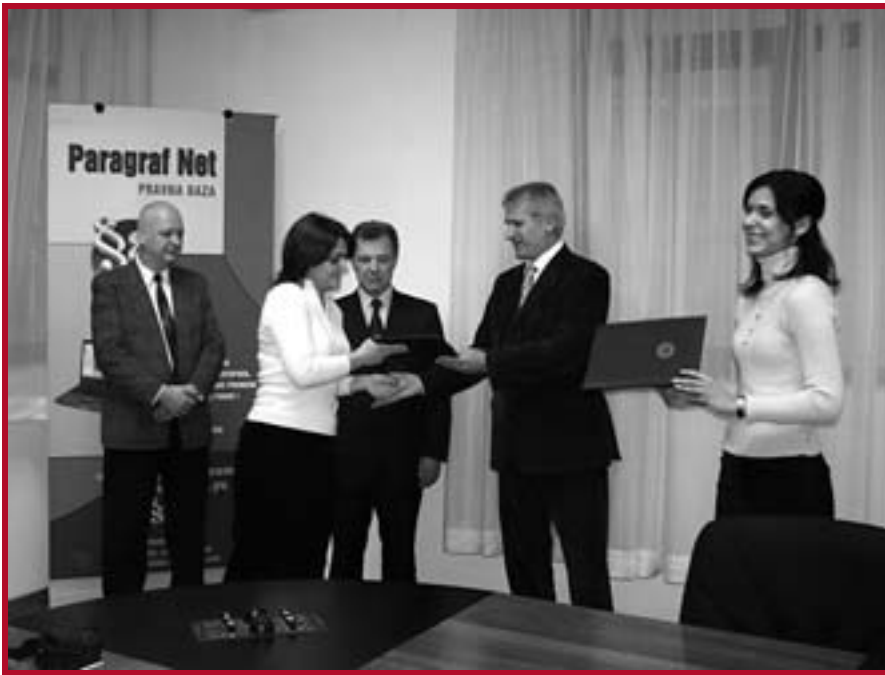
Додела диплома полазницима курса у организацији компаније „Параграф“ и нашеј Факултету

торији и трајала је наредних десет дана. Одзив студената је био изузетно велики, па је попуњен број и за следећу групу.