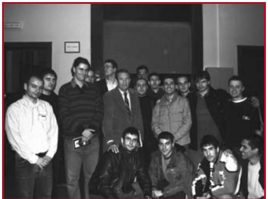
Ремзи Кларк са студентима нашег Факултета у амфитеатру V

11. новембра 2005. године, у организацији Удружење студената Правног факултета ‘Номоканон,’ гост Правног факултета био је Ремзи Кларк, некадашњи јавни тужилац, заменик министра правде, помоћник министра правде и министар правде САД, који је у пуном амфитеатру V одржао пре-