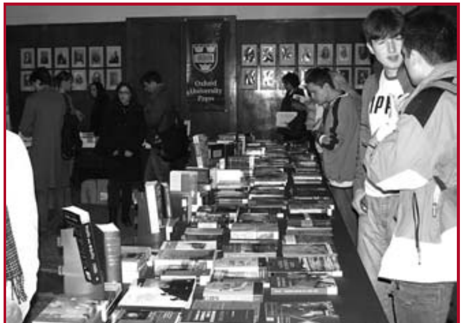
Са продајне изложбе компаније „The English Book“ на нашем Факултету

The English Book и Правни факултет Универзитета у Београду организовали су продајну изложбу најновијих академских наслова на енглеском језику из области права, политике, историје и других дру-