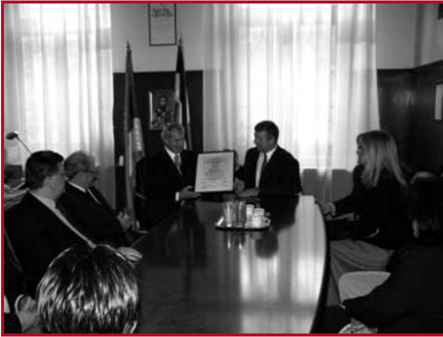
ЊКВ Александар II Карађорђевић у разговору са професорима нашег Факултета

буде расадник истине, слобода и правде. Нека се у њој спремају будуће генерације младих правника који ће предано и савесно вршити своје грађанске дужности на општу корист народа“.