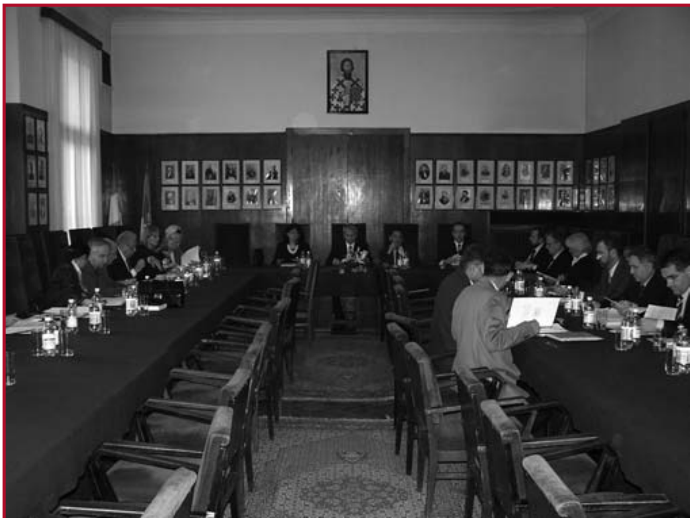
Учесници Конференције правних факултета Србије

1. Трајање студија права. Новим Законом о високом образовању, у који су уграђена начела Болонског процеса, предвиђена су два циклуса академских студија, при чему је високошколским институцијама остављена слобода да одаберу модел 3+2 или 4+1 година студија. Имајући у виду значај правничке професије, процењено је да два циклуса студија права треба да се одвијају по моделу 4+1. При том студент који заврши први циклус од 4 године, у складу са типологијом и терминологијом из новог Закона, добија звање „правник“ (енгл. bachelor ), а тек студент који заврши још једну годину стиче звање „дипломирани