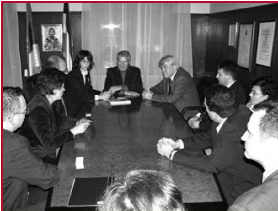
Делегација бугарске владе у посети нашем Факултету