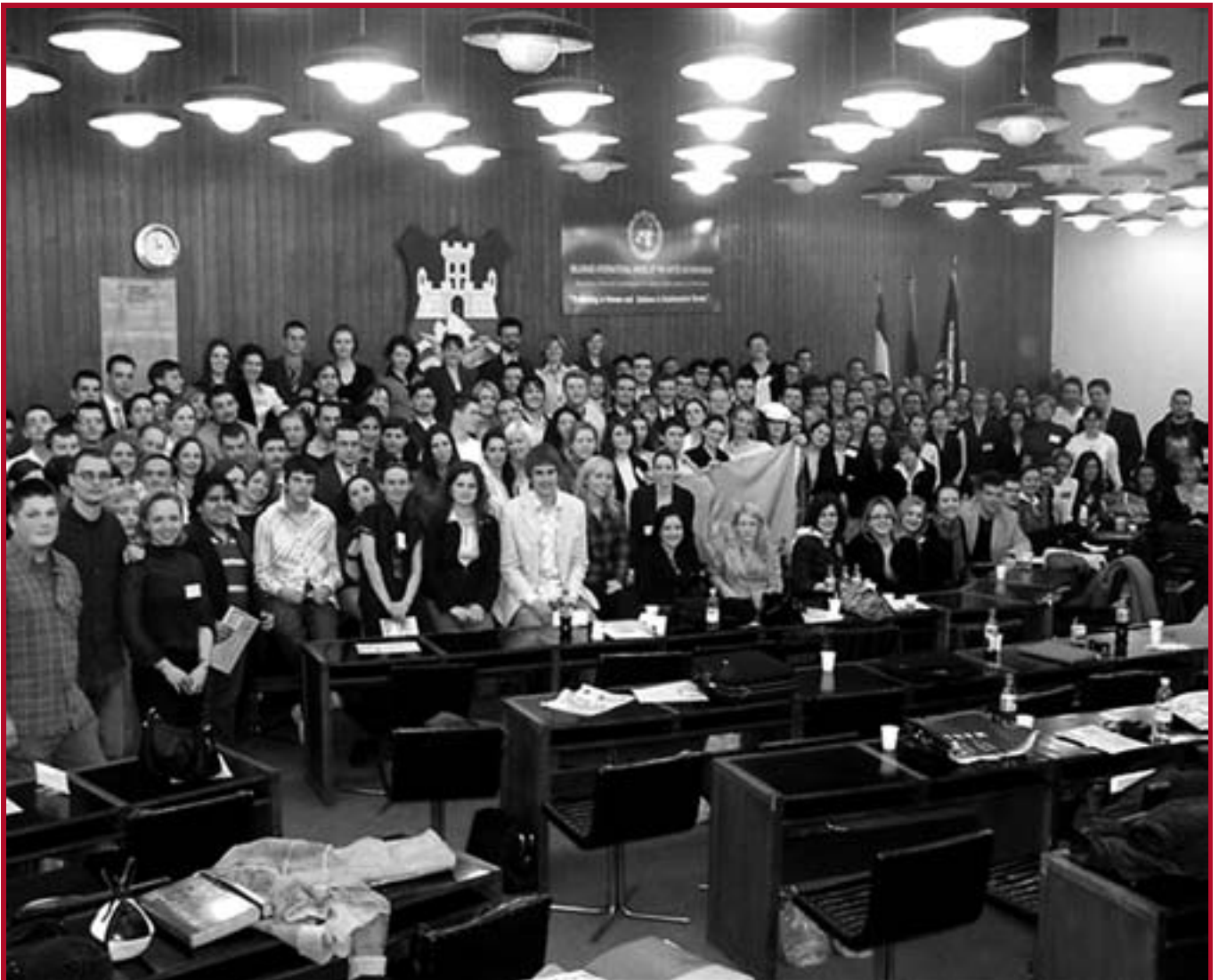
Учесници треће међународне београдске модела УН

Учесници Модела били су студенти и постдипломци друштвених наука из Србије и Црне Горе,