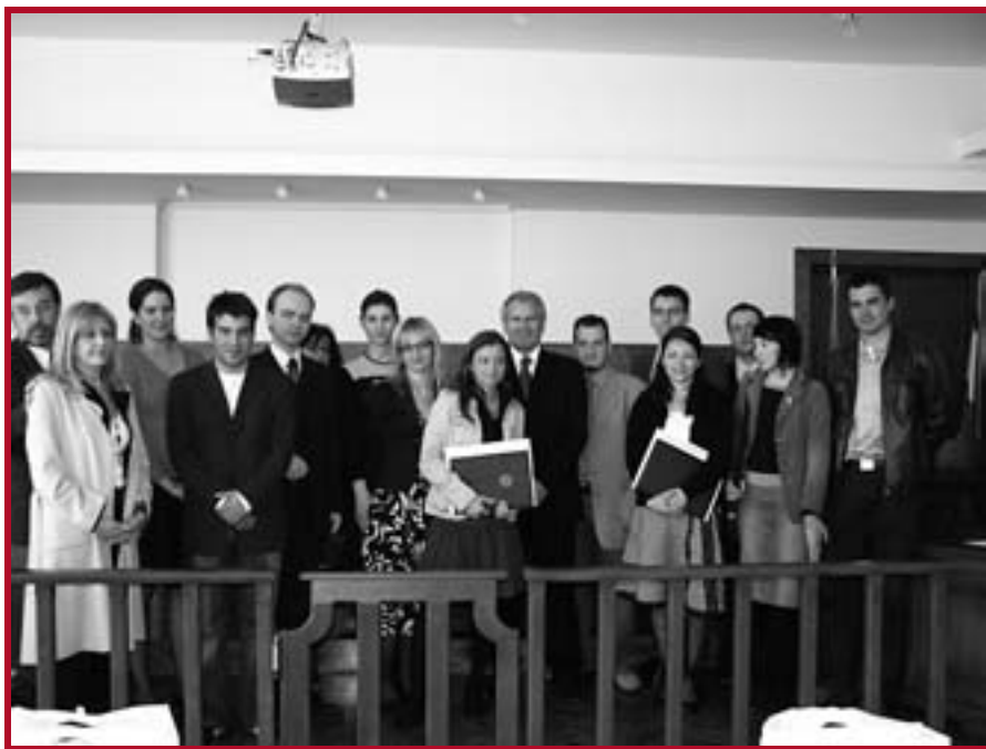
Учесници такмичења на свечаном пријему на Факултету

И да није остварен овако запажен резултат, само присуство међу најперспективнијим младим правницима света је изузетно значајно и вредно искуство за наше студенте, а узастопни успех нашег тима је потврда озбиљности и квалитета образовања у Београду и Србији, а уједно позив и подстрек, како студентима – тако и професорима и стручњацима да се ангажују на овом значајном пројекту, који полако постаје заштитни знак београдског Правног факултета. О успеху нашег Факултета трајно ће сведочити и списак финалиста доступан на веб страници Пејс Универзитета: http://www.cisg.law.pace.edu/cisg/moot/awards13.html