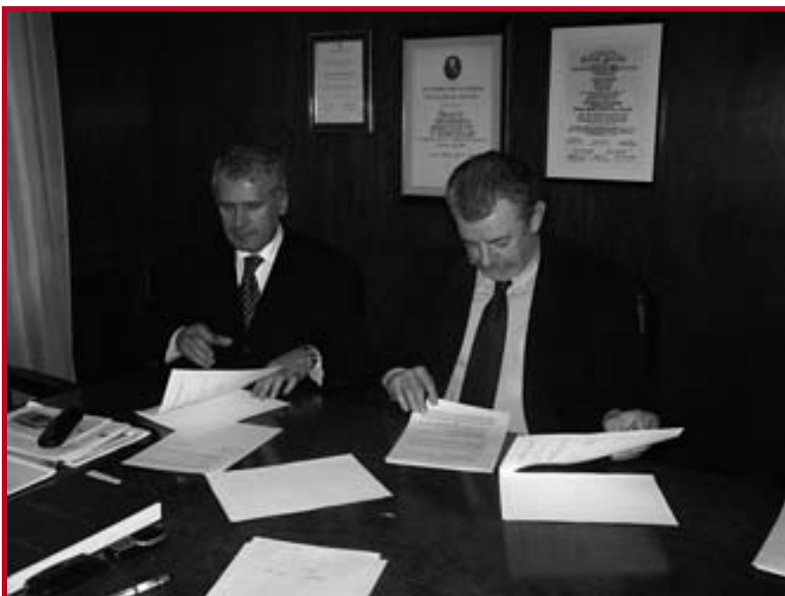
Потписивање споразума о сарадњи између нашег Факултета и Службеног гласника