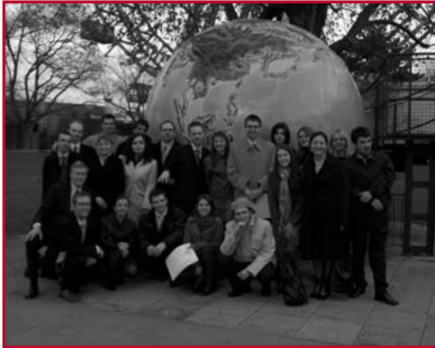
Наш тим са колеџама из Пиџсбурја, Пришћине, Кијева и Доњеца

Ово такмичење се састоји у решавању једног задатог случаја из области Права међународне про-