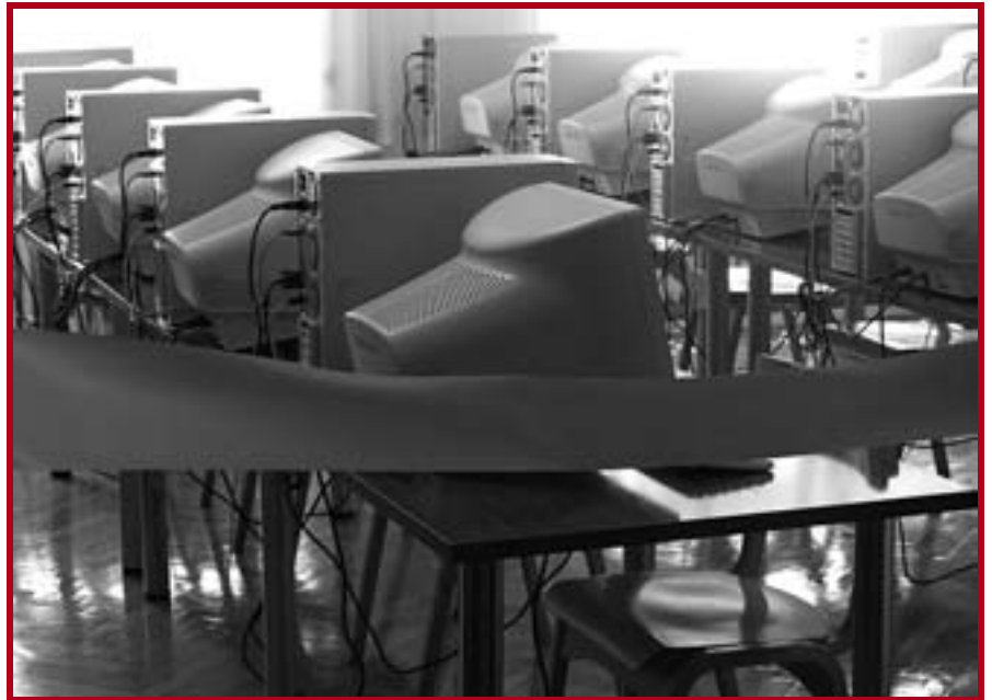
Модерно опремљена студијска компјутерска лабораторија

Рачунарска мрежа на Правном факултету и њена оптичка веза са Интернетом преко Рачунарског центра Универзитета (РЦУБ) реализовани су пре 10-так година и тада