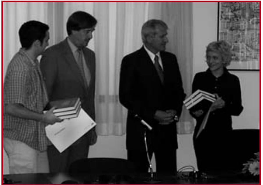
Додела награда победницима конкурса за најбоље есеје на тему „Мир кроз међународно право“