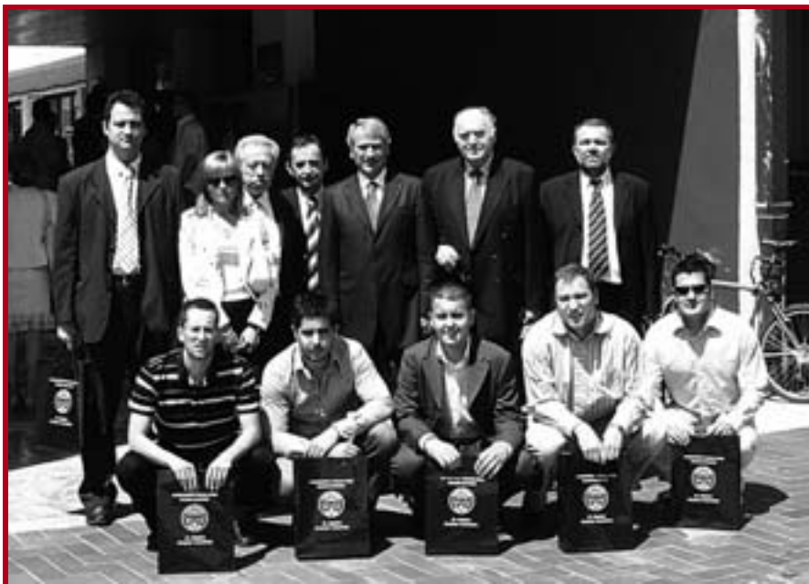
Делегација нашег Факултета у Бања Луци