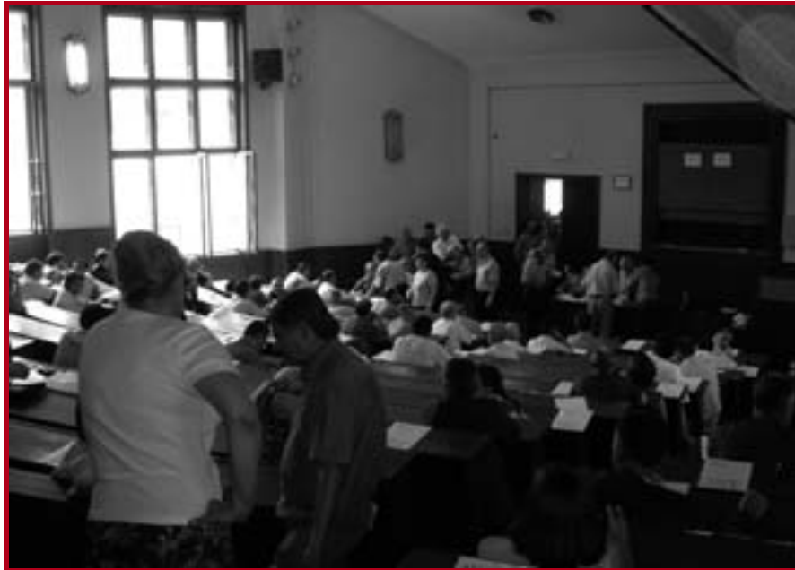
Полагање стручног испита за стечајне управнике у амфитеатру V

Правни факултет Универзитета у Београду и Агенција за лиценцирање стечајних управника Републике Србије, организовали су припремну наставу за стицање лиценце за стечајне управнике.