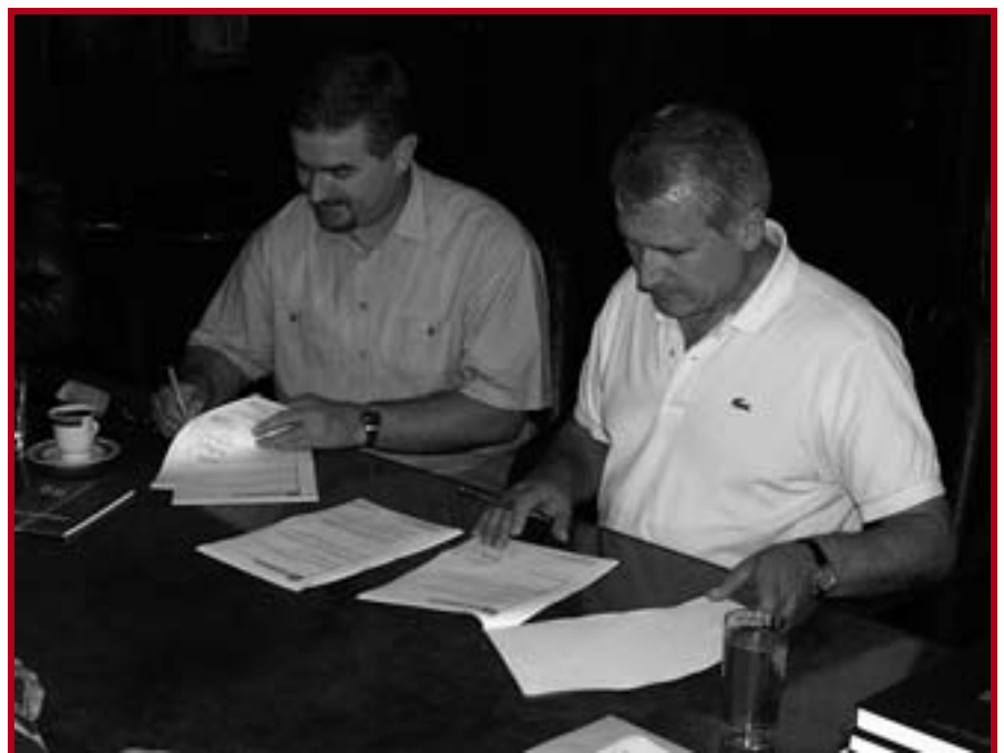
Потписивање Протокола о сарадњи нашег Факултета и фирме Paragraf Co