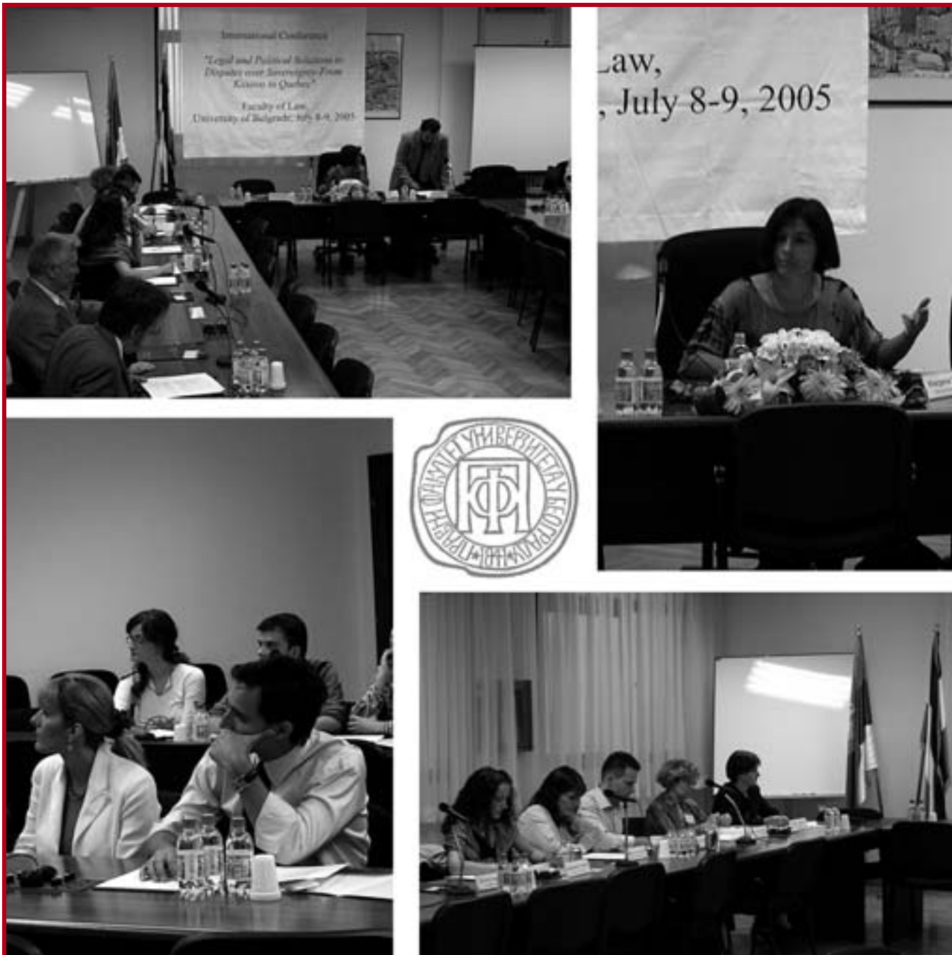
Учесници Међународне конференције о споровима око суверенитета

На нашем Факултету је 8. и 9. јула одржана Међународна конференција Legal and Political Solutions to Disputes over Sovereignty – From Kosovo to Quebec , на којој су радове представили учесници из Србије, Канаде, Аустралије, Македоније, Швајцарске и Холандије.