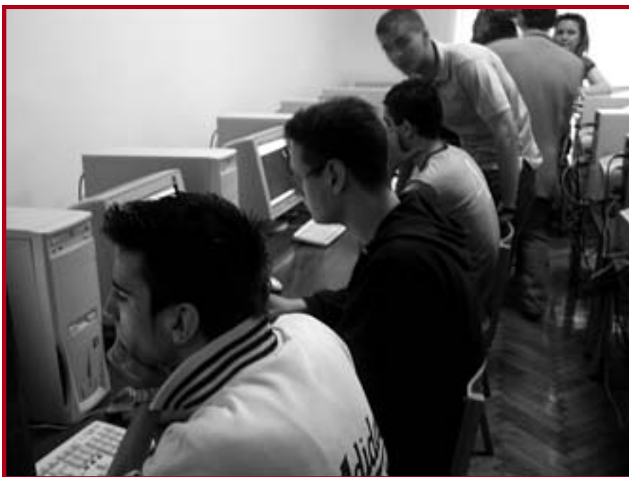
Студенти у компјутерској лабораторији

Нова интернет презентација Правног факултета ( www.ius.bg.ac.yu ) завршена је у садржинском погледу током јуна и јула 2005. године креирањем нових делова Студије, Научни рад и публикације, као и уводног дела О Факултету.