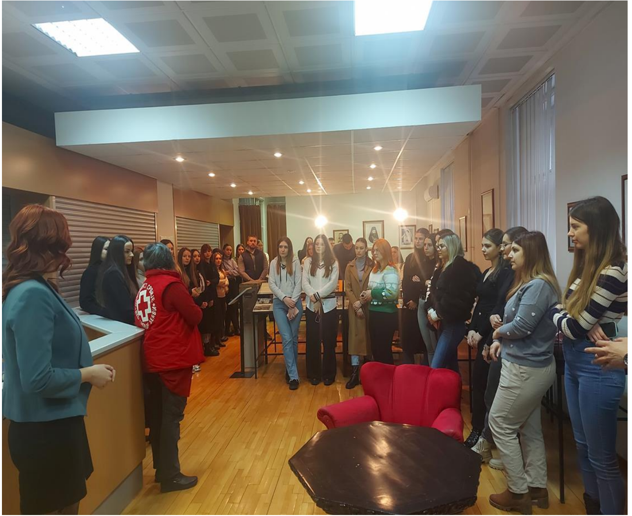
Полазници Правне клинике за сузбијање трговине људима на радионици у Црвеном крсту Србије.