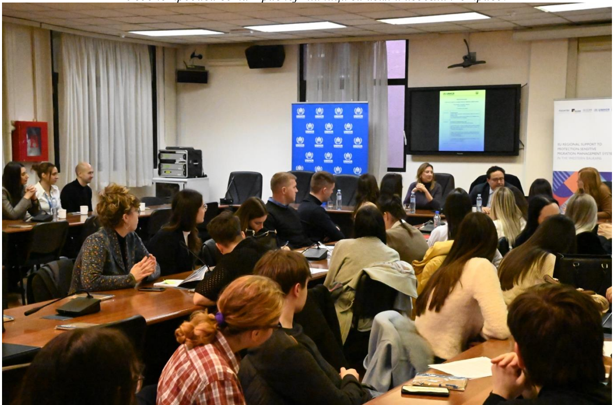
Студентска конференција "Право на азил - 75 година од усвајања Универзалне декларације о људским правима".