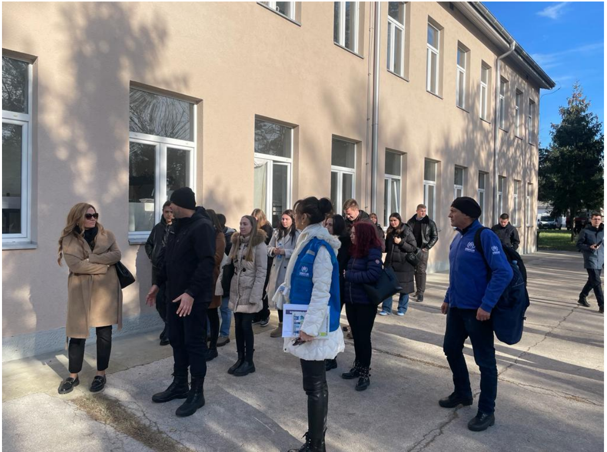
Посета полазника Правне клинике за азил и избегличко право Центру за азил у Обреновицу.