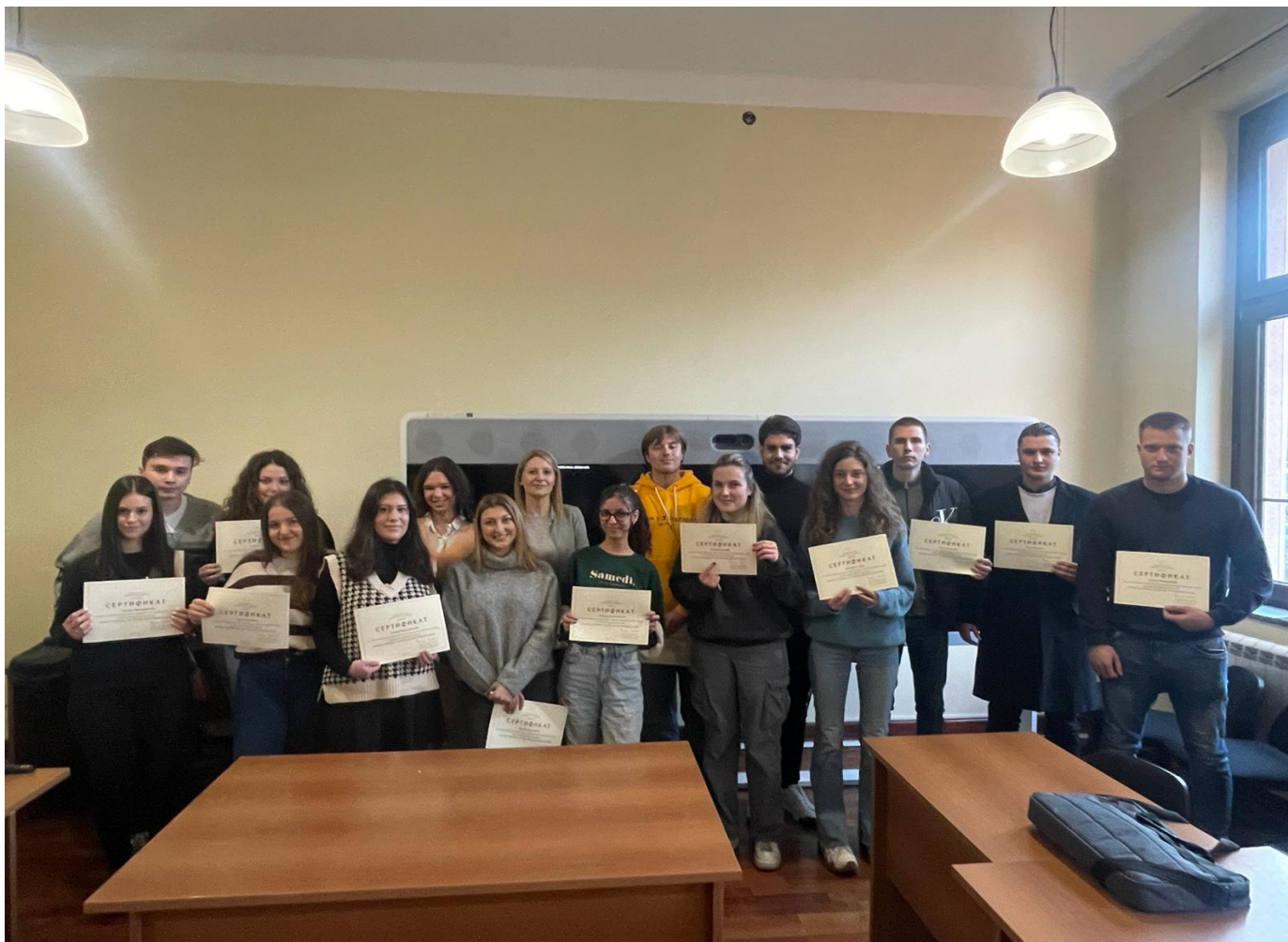
Додела сертификата полазницима Правне клинике за питања дискриминације за успешно завршен програм.