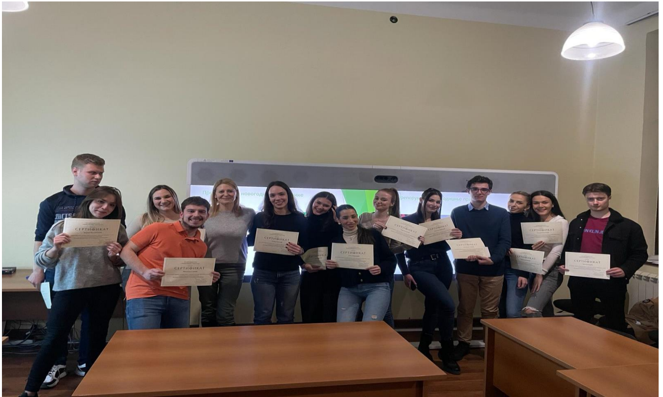
Додела сертификата полазницима Правне клинике за сузбијање корупције за успешно завршен програм.