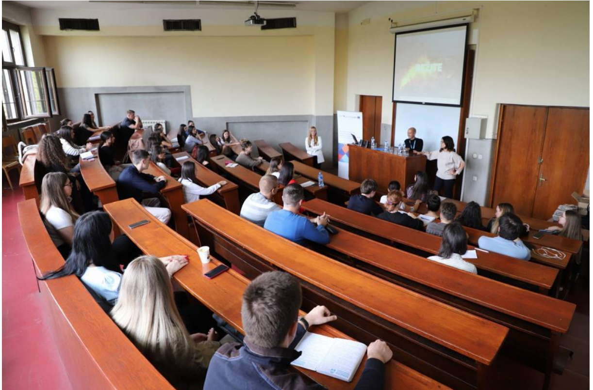
Уводно предавање на Правној клиници за азил и избегличко право.