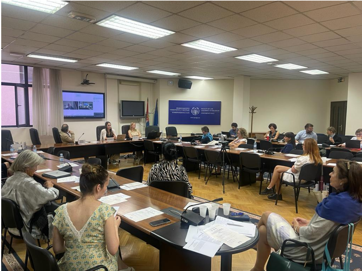
Drugi dan međunarodne konferencije „Da li su manjinska prava (još uvek) ljudska prava?“

Konferencija je okupila istaknute profesore i profesorke, kao i eksperte i ekspertkinje sa višegodišnjim iskustvom u oblasti manjinskih prava što je posebno doprinelo kvalitetu diskusija o izazovima i mogućim pravcima za razvoj u oblasti zaštite manjina.